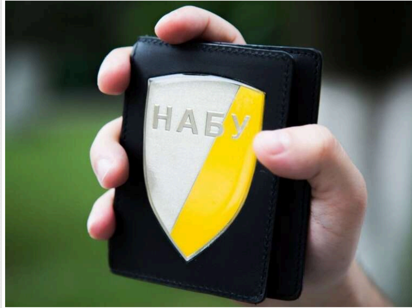
Справа поліграфкомбінату «Україна»: з-за кордону повернули 450 тисяч євро заарештованих коштів

За результатами розслідування спільної міжнародної слідчої групи за участю України, Франції та Естонії з-за кордону повернуто 450 тис. євро у справі про корупцію на ДП «Поліграфкомбінат "Україна"», повідомляє Спеціалізована антикорупційна прокуратура (САП).