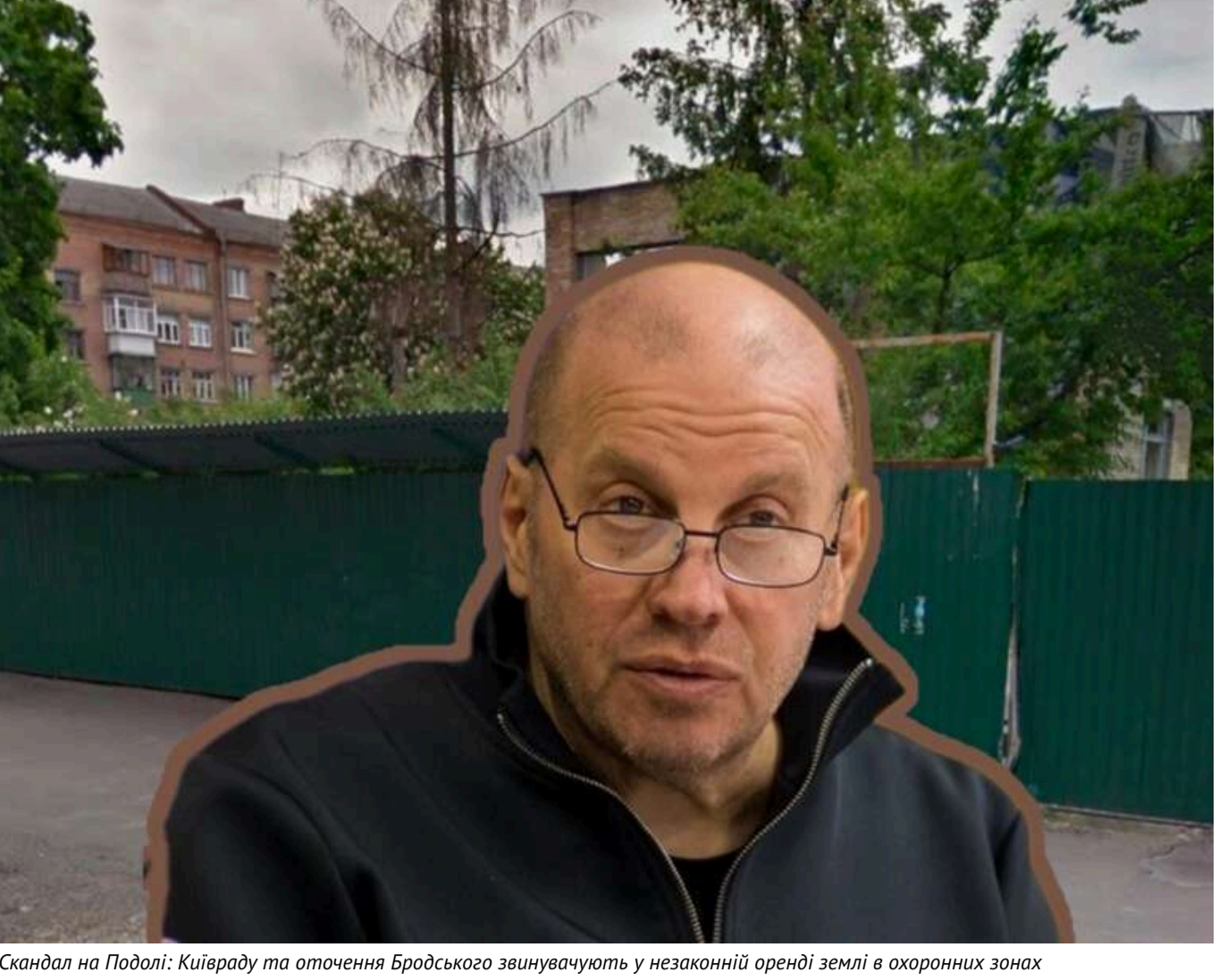
Скандал на Подолі: Київраду та оточення Бродського звинувачують у незаконній оренді землі в охоронних зонах

Черговий будівельний скандал розгоряється на столичному Подолі. Там, на місці колишнього дитсадка "Лірець" на вул. Юрківській, 25, розпочинається зведення нового ЖК.