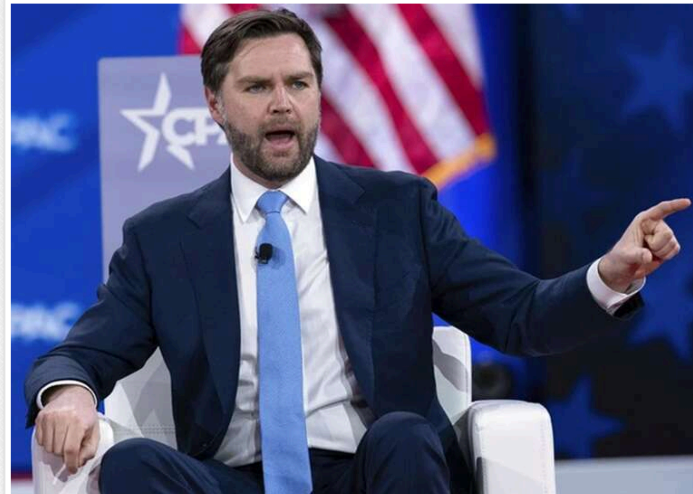
Мир в Ормузькій протоці: Джей Ді Венс заявив про дотримання угоди між США та Іраном

США та Іран виконують умови мирної угоди, рух суден через Ормузьку протоку відновлено, повідомив віцепрезидент США Джей Ді Венс.