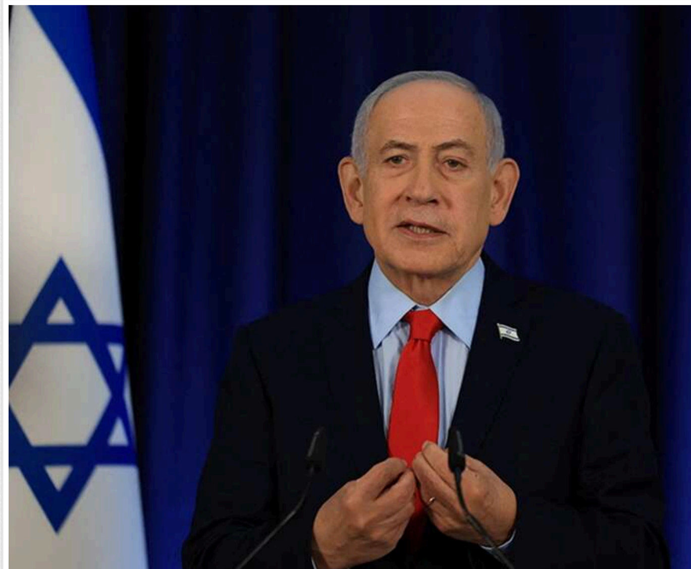
Нетаньягу заявив, що Ізраїль поки не виводитиме війська з Південного Лівану

Нетаньягу заявив, що Ізраїль не має наміру виводити війська з Південного Лівану, керуючись міркуваннями безпеки.