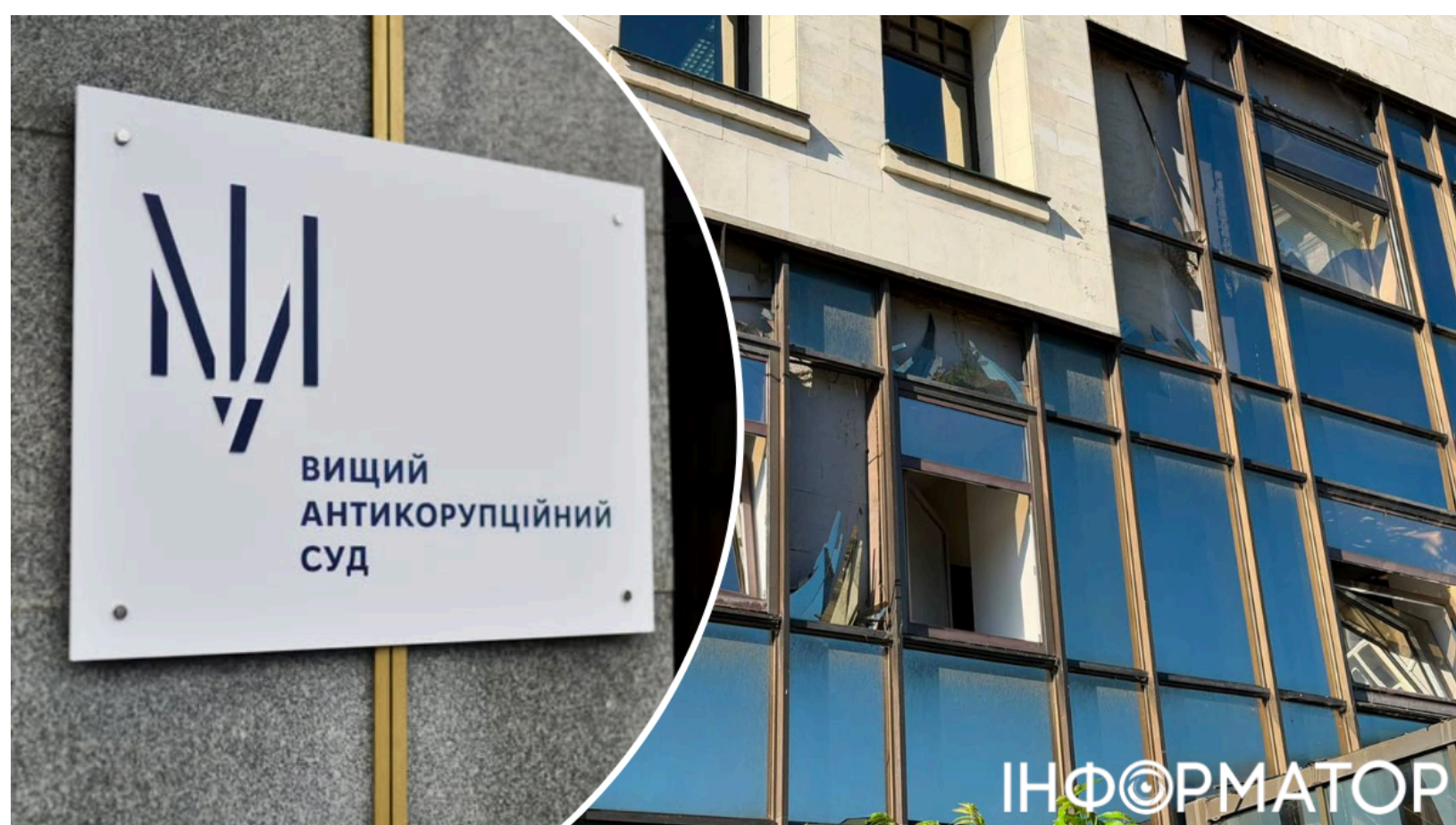
ВАКС отримав постійне приміщення в Києві

Вищий антикорупційний суд нарешті отримає повноцінне постійне приміщення - уряд передає ВАКС будівлю в Києві після понад шести років роботи в тимчасових та розрізних локаціях. Будівля ВАКС на Берестейському проспекті , де суд розглядав справи першої інстанції, минулого тижня постраждала внаслідок масованого удару Росії по Києві - вибухова хвиля вибила вікна. Проблема зі сталим розміщенням суду залишалася невирішеною з моменту його запуску у вересні 2019 року - і саме зараз її вдалося подолати завдяки особистій участі керівника Офісу президента Кирила Буданова.