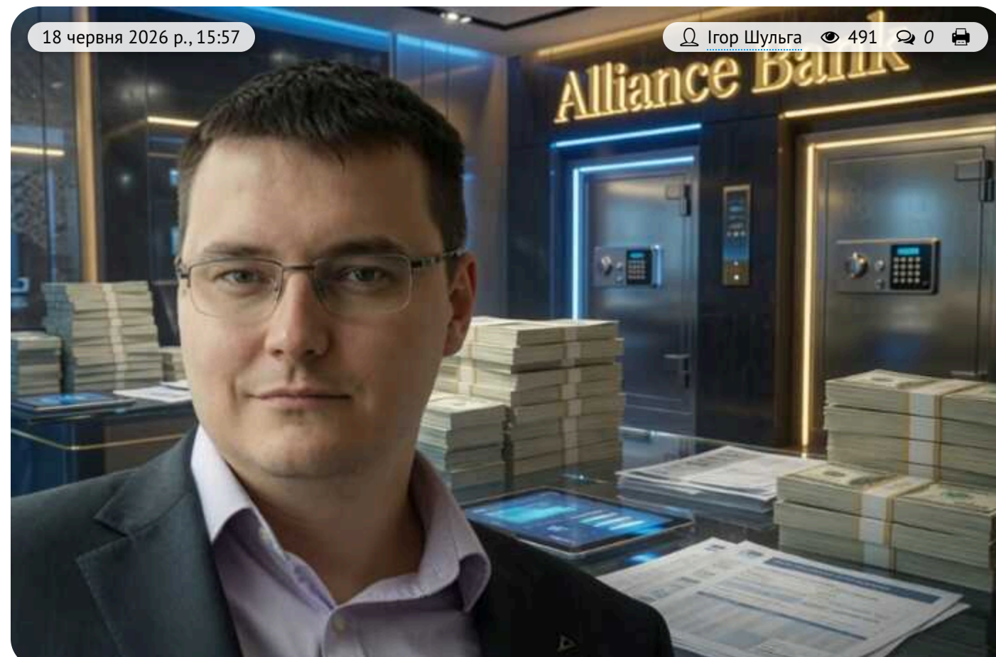
Від мільярдних боргів до IT-компаній і аграріїв: Павло Щербань виводить активи «Банку Альянс» перед фінансовим обвалом

Згідно з джерелами, реальний бенефіціар банку «Альянс» Павло Щербань вживає заходів для зниження власних ризиків на тлі очікуваного виведення фінансової установи з ринку. У медійному полі та в контексті діяльності банку також фігурує ім'я бізнесмена Дмитра Фірташа.