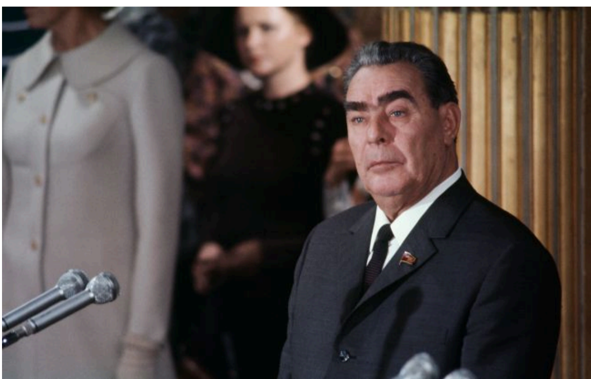
Фото: радянський генсек Леонід Брежнєв

Розумій ситуацію на фронті через факти, а не чутки з РБК-Україна у Google