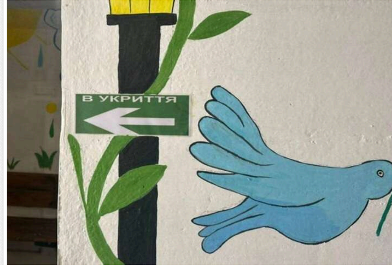
Замість захисту – небезпека: на Дніпропетровщині експосадовицю підозрюють у закупівлі непридатних укриттів на понад 6 мільйонів гривень

Читати на руском Read in English Додати як бажане джерело в Google