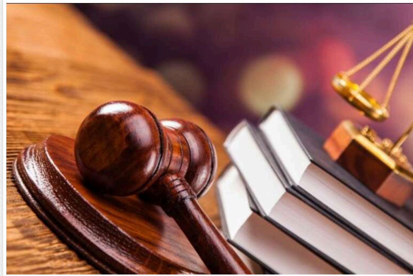
Намагався вивезти ліс за кордон: на Волині засудили підприємця, який підробив документи на деревину

Любомльський районний суд Волинської області виніс вирок фізичній особі-підприємцю, який намагався незаконно вивезти за кордон велику партію пиломатеріалів. Підприємець намагався легалізувати товар через підроблені документи, проте «схему» викрили працівники Бюро економічної безпеки.