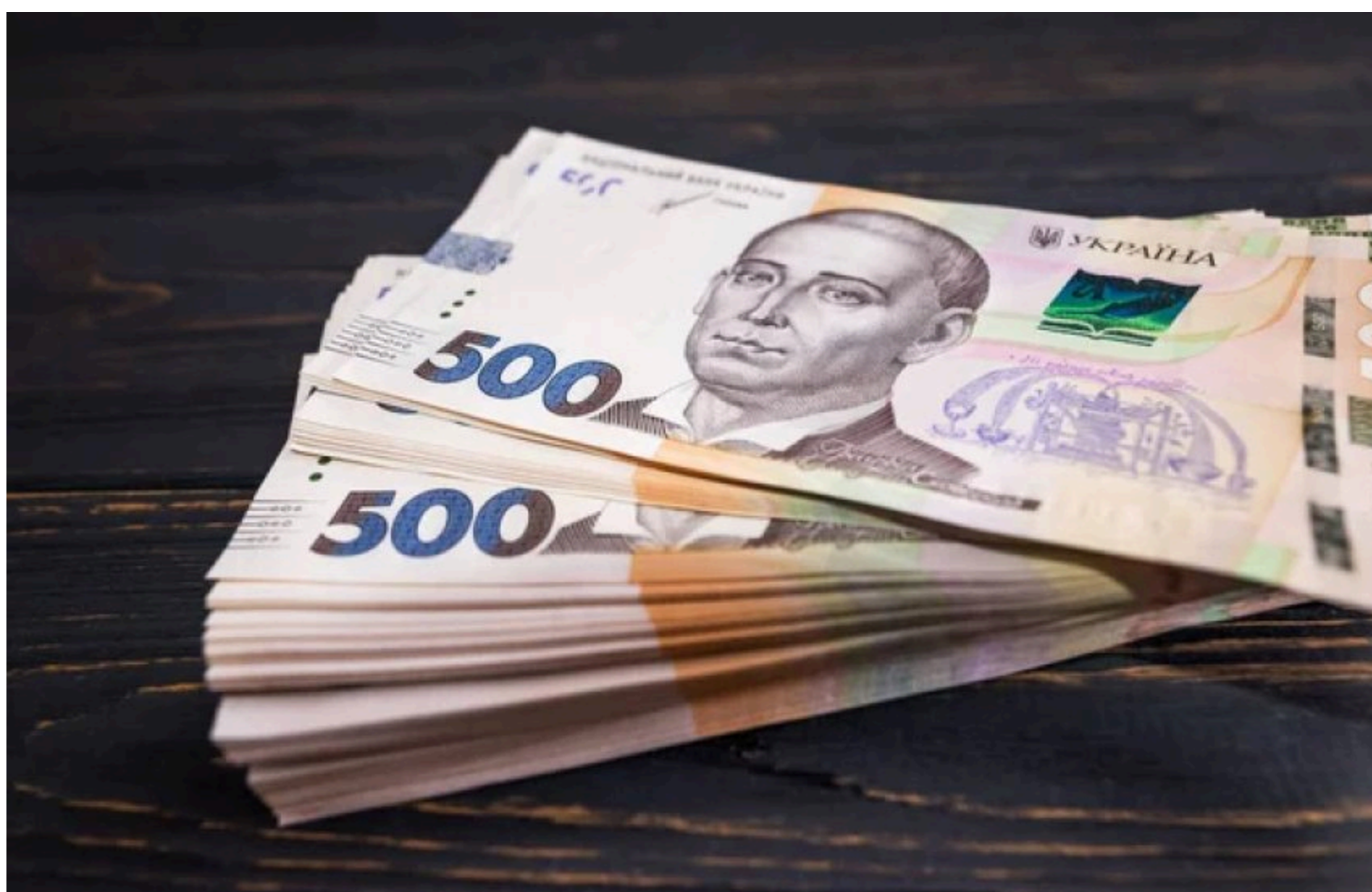
Рада розблокувала закон про 1,56 трлн грн на оборону

Верховна Рада відхилила сім проєктів постанов, які блокували підписання закону про зміни до державного бюджету на 2026 рік. Документ передбачає збільшення видатків на сектор безпеки й оборони на 1,56 трлн грн за рахунок фінансової допомоги Європейського Союзу.