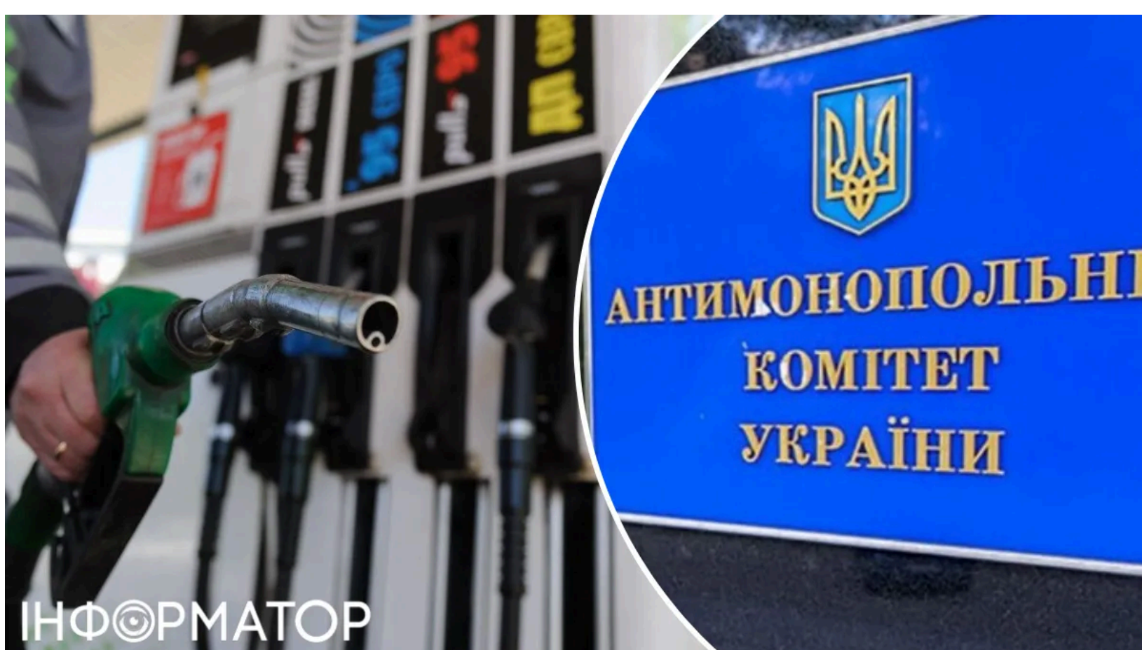
АМКУ не знайшов змови на ринку пального

Антимонопольний комітет України завершив аналіз ситуації на ринку нафтопродуктів і не виявив ознак картельної змови серед операторів АЗС. Раніше стрибок цін на пальне спонукав АМКУ назвати суму можливого штрафу для мереж заправок. Водночас регулятор наполягає: АЗС зобов'язані знизити роздрібні ціни у відповідь на падіння світових котирувань на нафту.