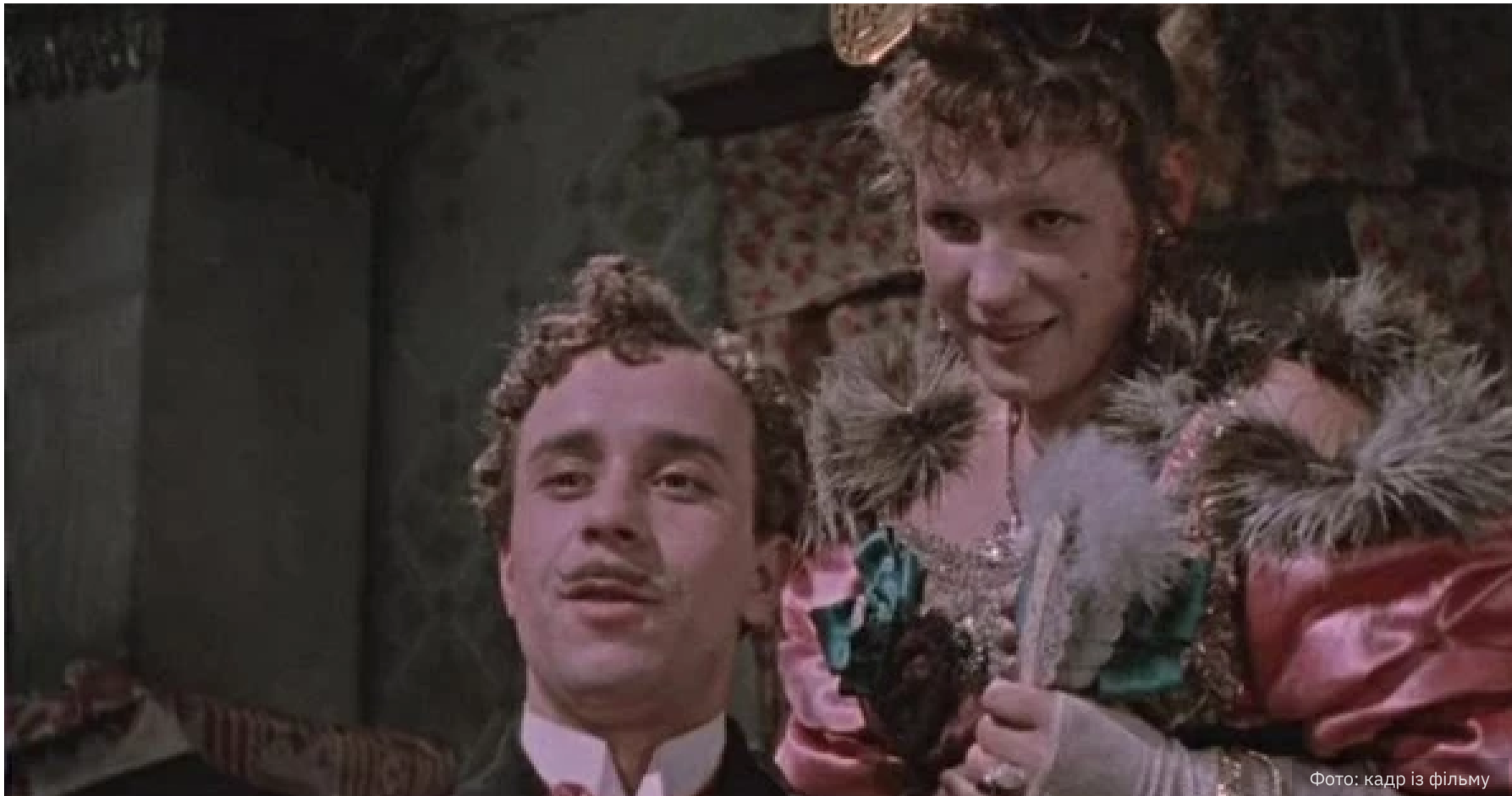
Фото, кадр із фільму