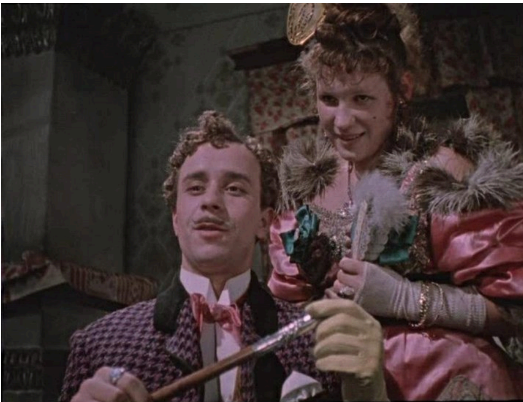
Кадр із фільму "За двома зайцями".

Новини по темі: кіностудія Довженка фільми російська агресія Війна України з Росією Тіні забутих предків Ракетний удар по Києву