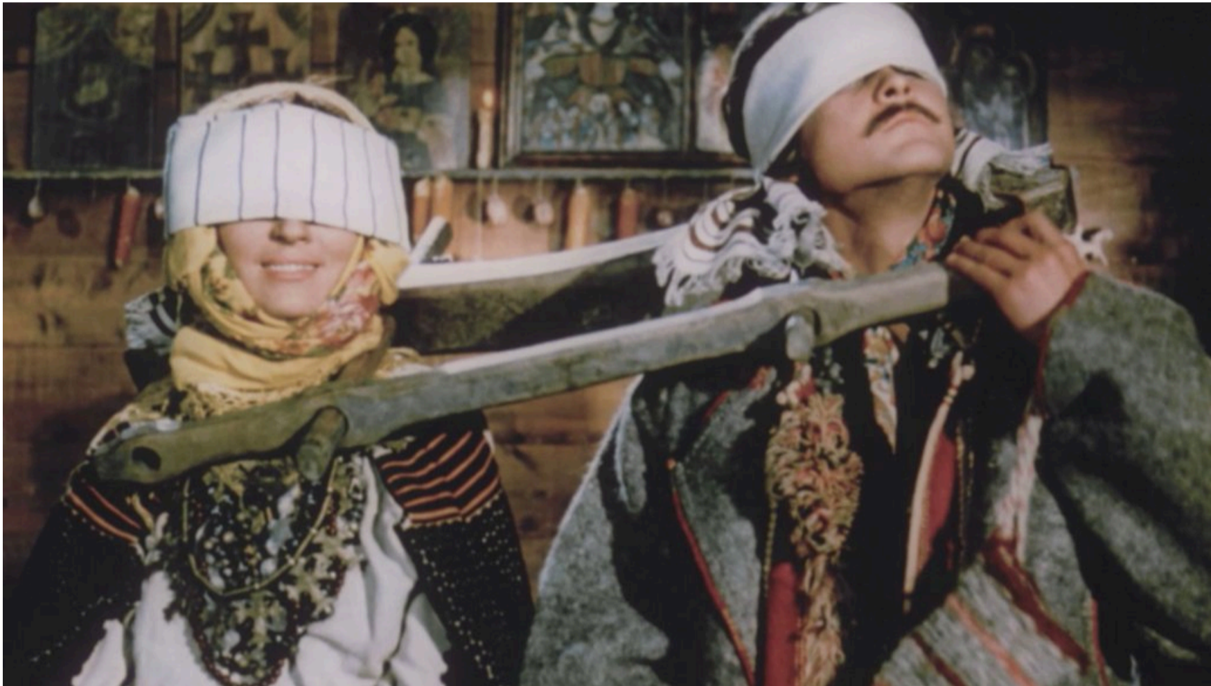
Кадр із фільму "Тіні забутих предків".