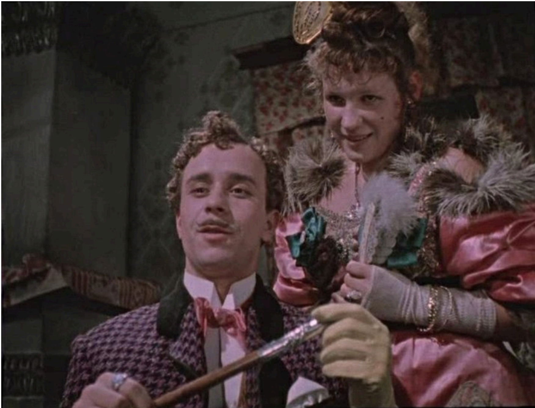
Кадр із фільму "За двома зайцями".

Новини по темі: кіностудія Довженка фільми російська агресія Війна України з Росією Тіні забутих предків Ракетний удар по Києву