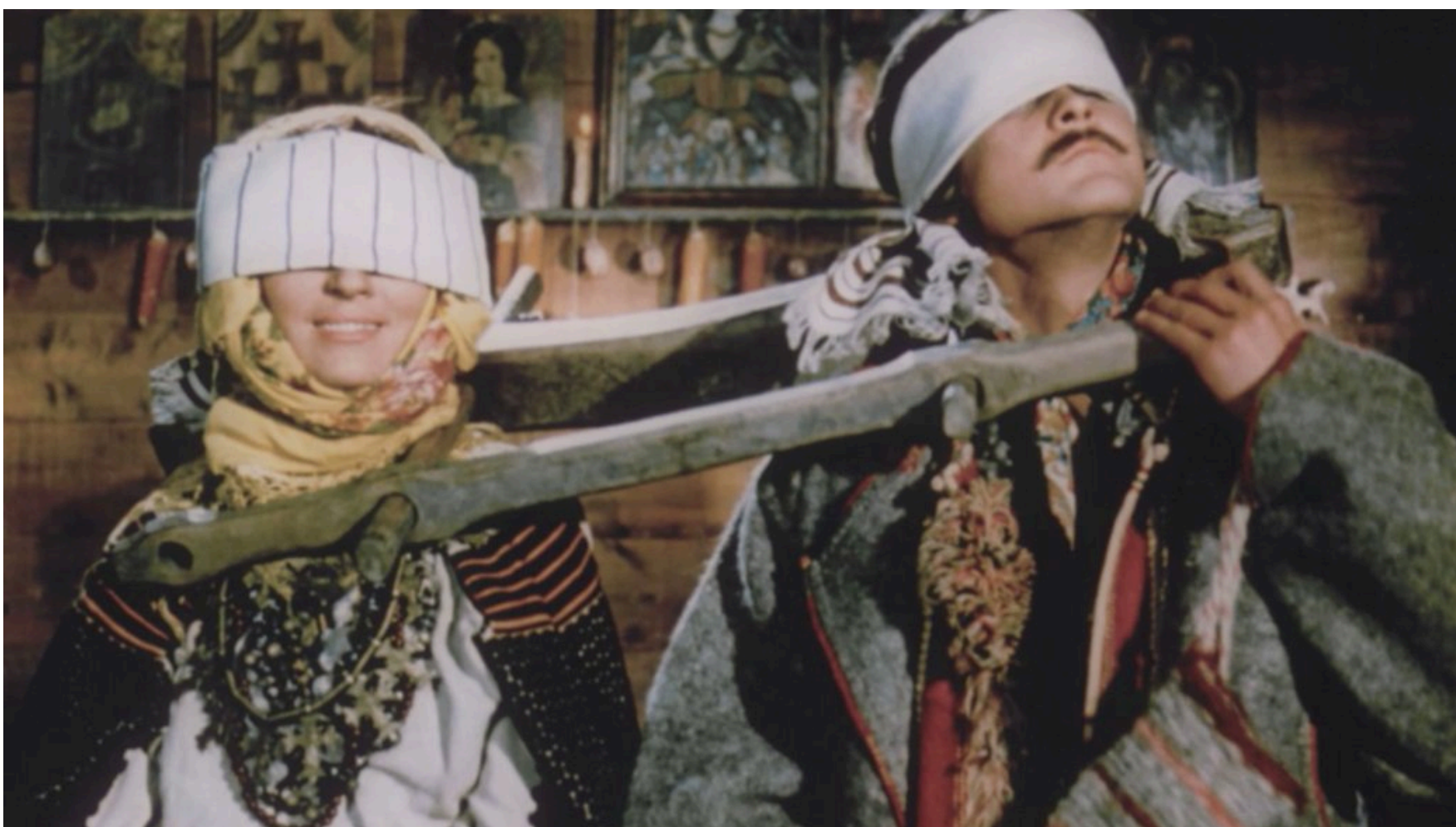
Кадр із фільму "Тіні забутих предків".