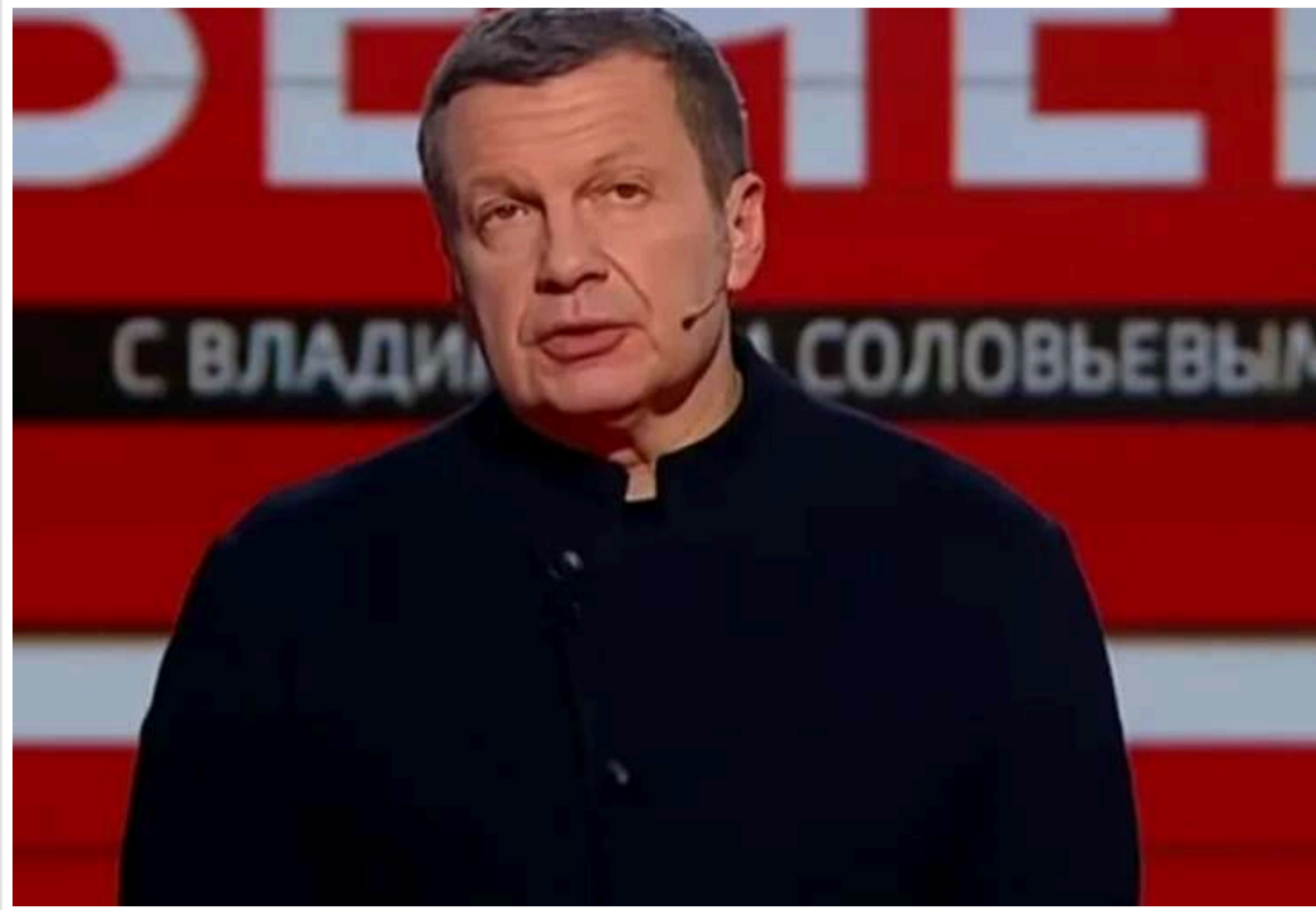
«Ідїть шляхом зрадників»: пропагандист Соловйов закликав наляканих атаками москвичів тікати з Росії

У російського пропагандиста Соловйова відняло мову після атак на Москву, у місті настала ніч.