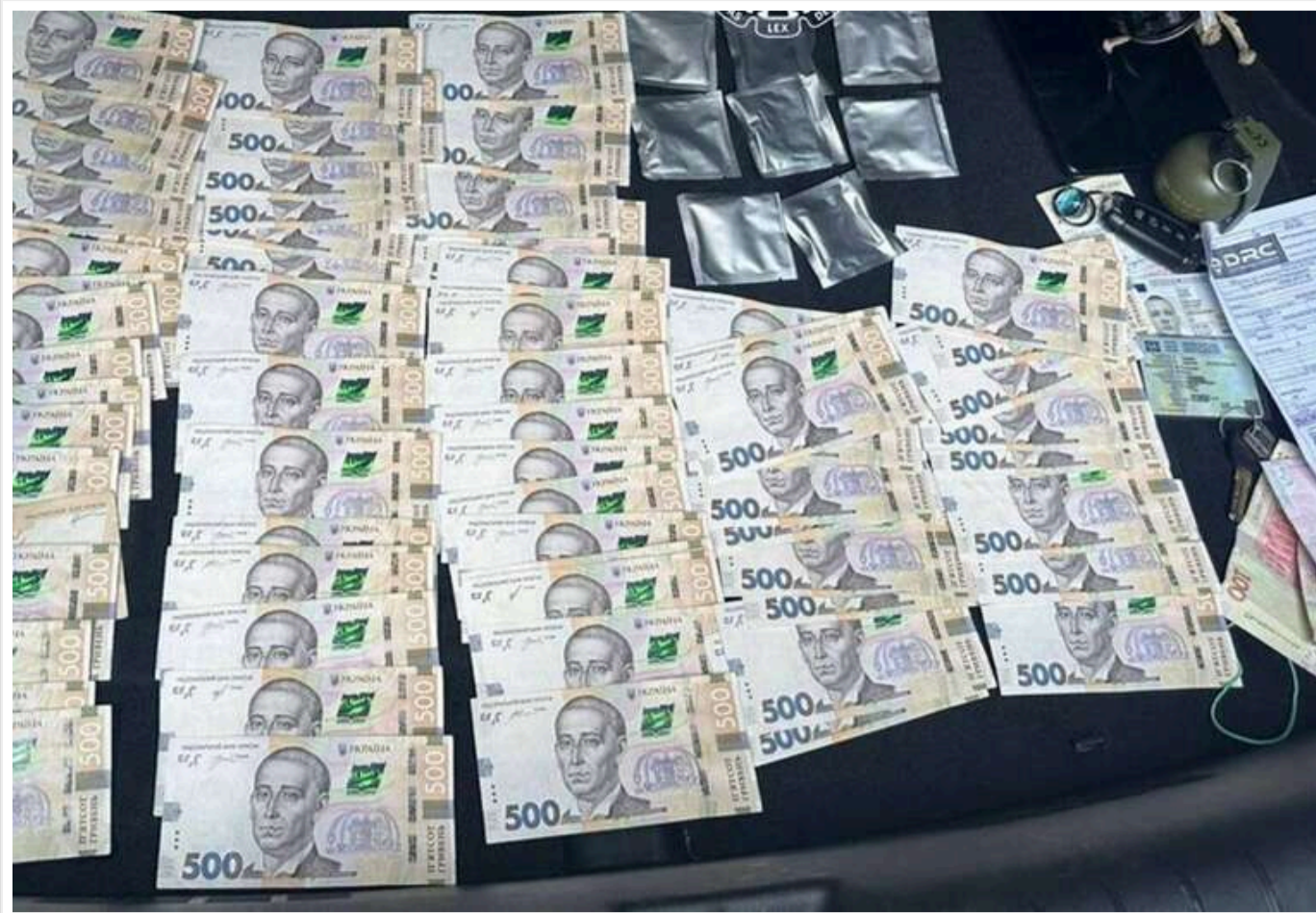
У Києві викрили наркоугруповання з 13 людей, яке збувало кокаїн на мільйони гривень

Читати на руском Read in English Додати як бажане джерело в Google