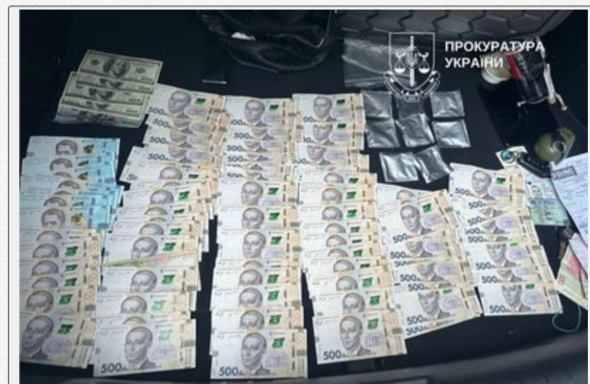
Гроші, які знайшли у підозрюваних під час обшуку.

Зазначається, що під час обшуків правоохоронці вилучили понад 600 доз кокаїну орієнтовно вартістю близько 2,5 мільйона гривень, значні суми готівкових коштів, мобільні телефони, засоби фасування, електронні ваги, а також 13 транспортних засобів.