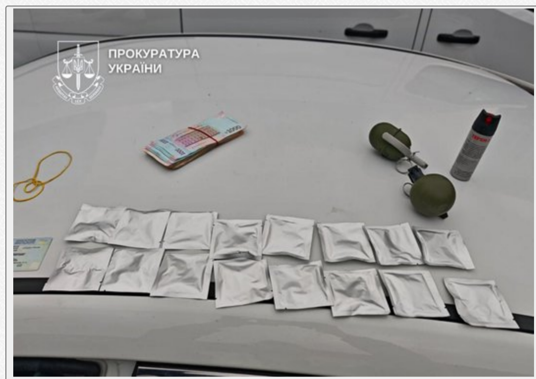
Пакетики з наркотиками, які вилучили у підозрваних.

Як повідомили у поліції, затримали 13 осіб, які входили до складу організованої злочинної групи.