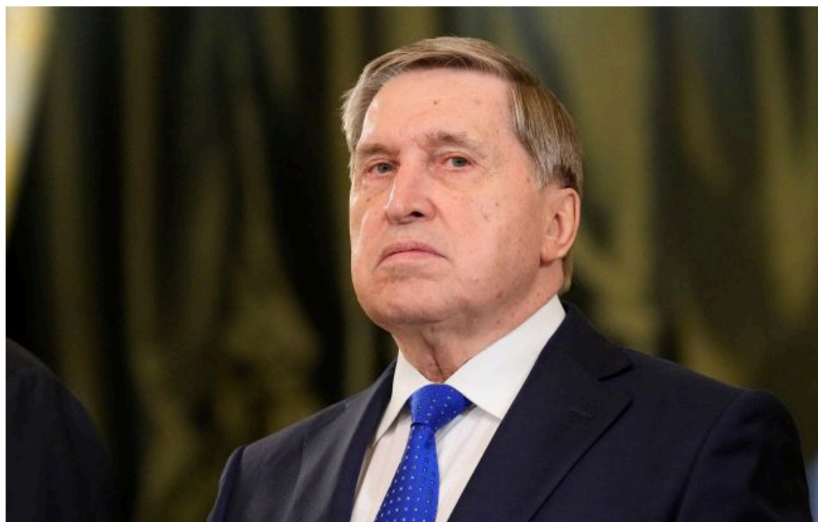
Фото: помічник Путіна Юрій Ушаков (Getty Images)