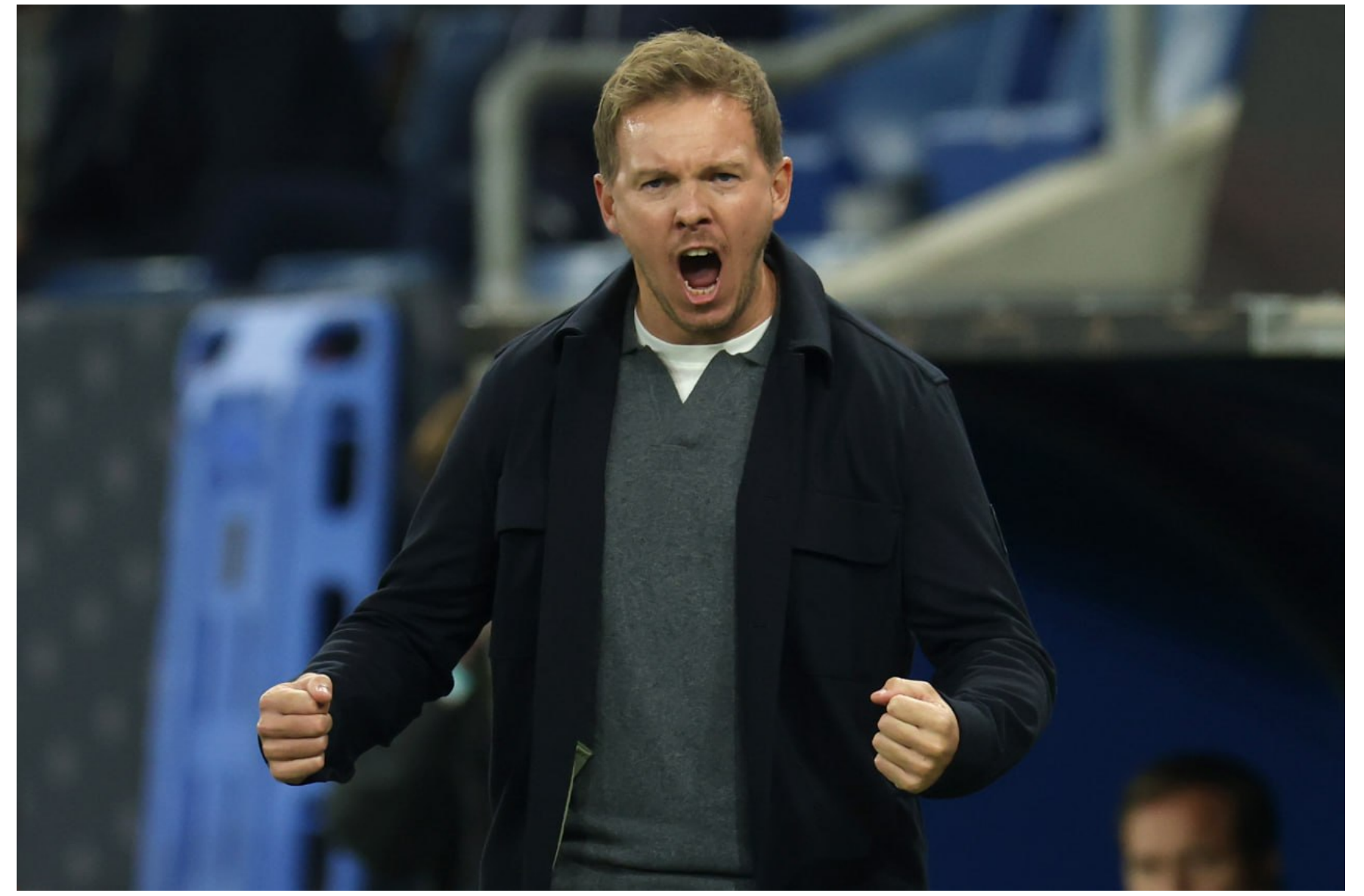
Юліан Нагельсманн любить незвичайні піджаки, водолазки та дизайнерські кросівки.

Kicker неодноразово зазначав, що Нагельсманн руйнує традиційний образ німецького тренера, який десятиліттями асоціювався з темними костюмами та строгими краватками. Навіть на офіційних заходах він часто виглядає радше як молодий керівник технологічного стартапу, ніж футбольний наставник.