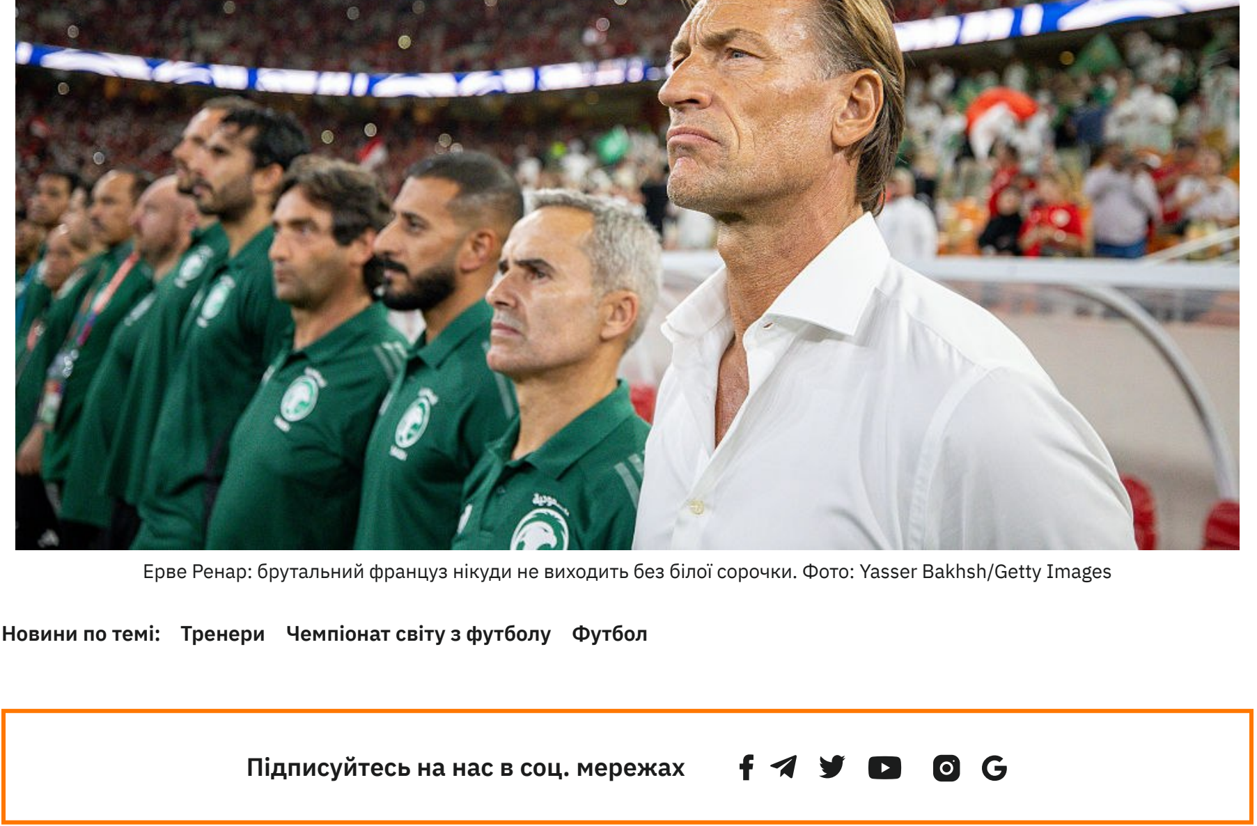
Ерве Ренар: брутальний француз нікуди не виходить без білої сорочки.

Сам Ренар колись пояснив свою любов до білої сорочки дуже просто: «Я не хочу думати про те, що вдягнути на матч».