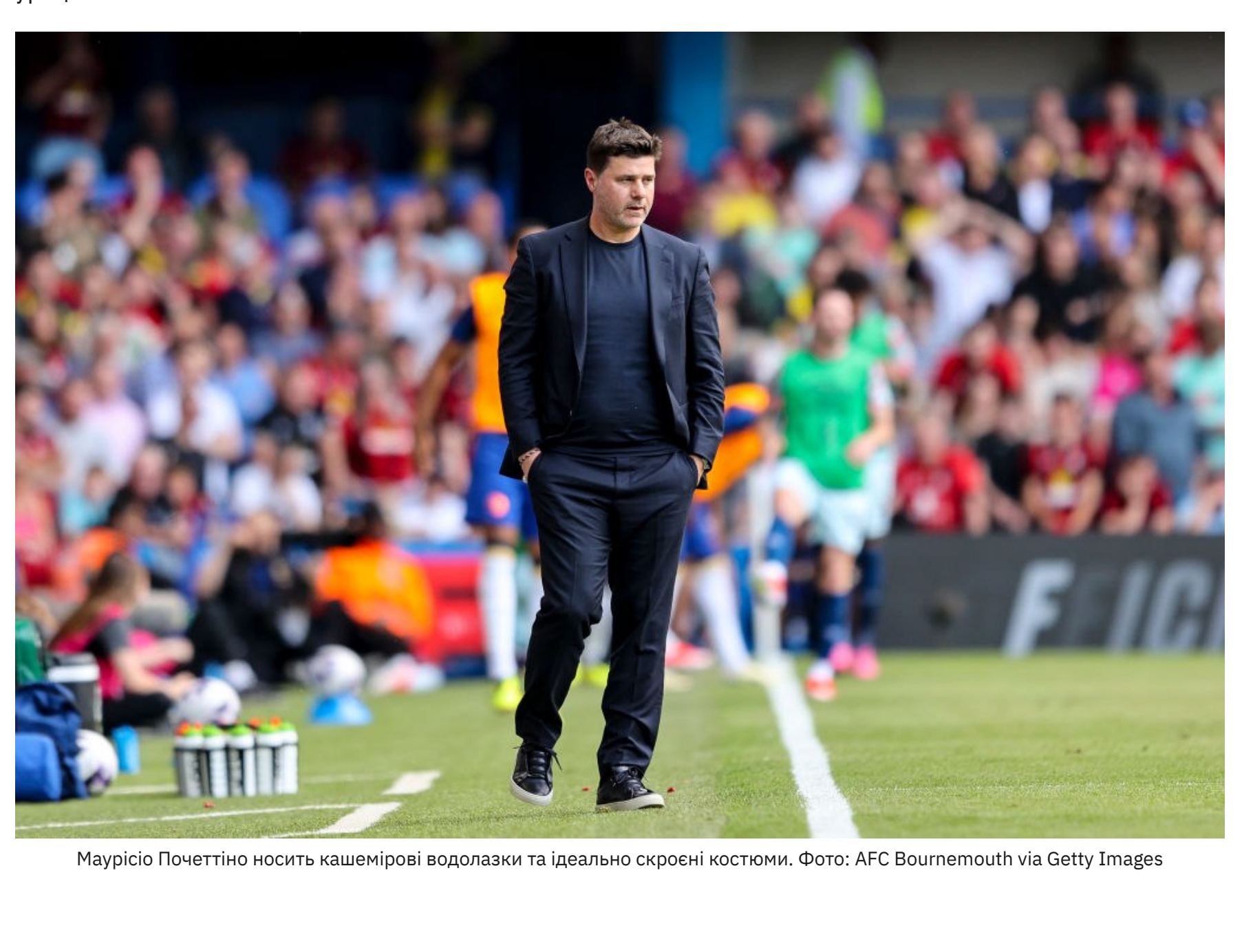
Маурісіо Почеттіно носить кашемирові водолазки та ідеально скроєні костюми.

GQ неодноразово включав аргентинця до добірок найбільш добре вдягнених людей футбольного світу. Особливо журналістам подобалася його здатність виглядати дорого навіть у звичайній тренувальній куртку.