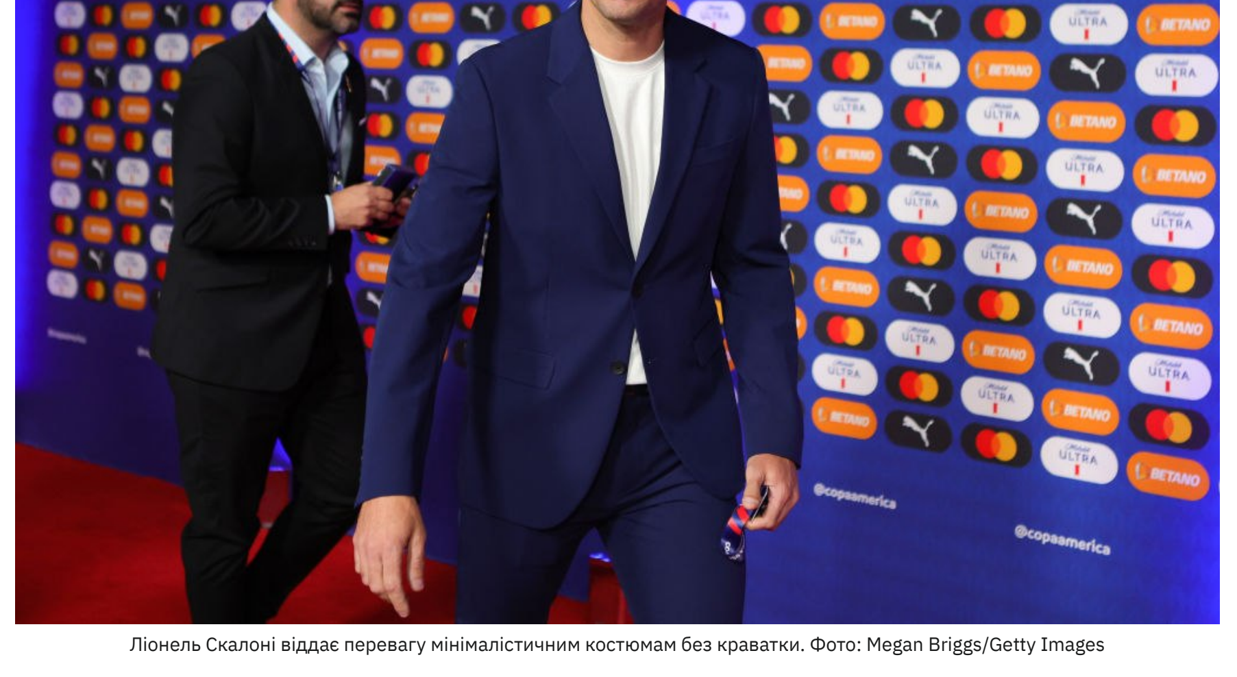
Ліонель Скалоні віддає перевагу мінімалістичним костюмам без краватки.

Журналісти зазначали, що тренер виглядає як успішний підприємець із Буенос-Айреса, а не як людина, яка щодня працює під колосальним тиском.