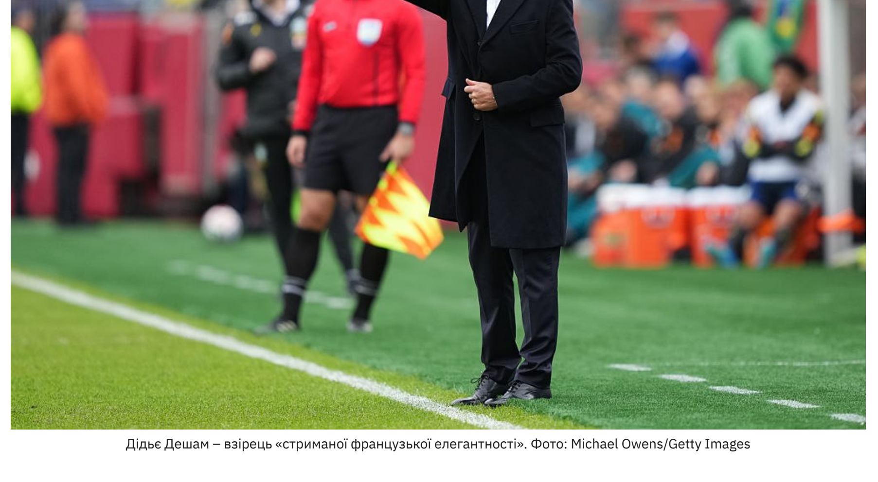
Дідьє Дешам — втілює «стриману французьку елегантність».

Сам Дешам ніколи не приховував, що любить порядок буквально в усьому — від тактики до зовнішнього вигляду. Можливо, саме тому його збірна залишається однією з найпланованих на турнірах.