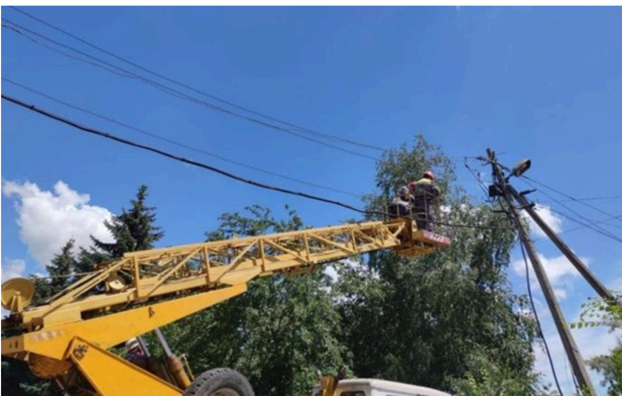
В енергетиці додалося роботи через нові обстріли і негодю

Там, де це наразі дозволяють безпекові умови, вже виконуються аварійно-відновлювальні роботи.