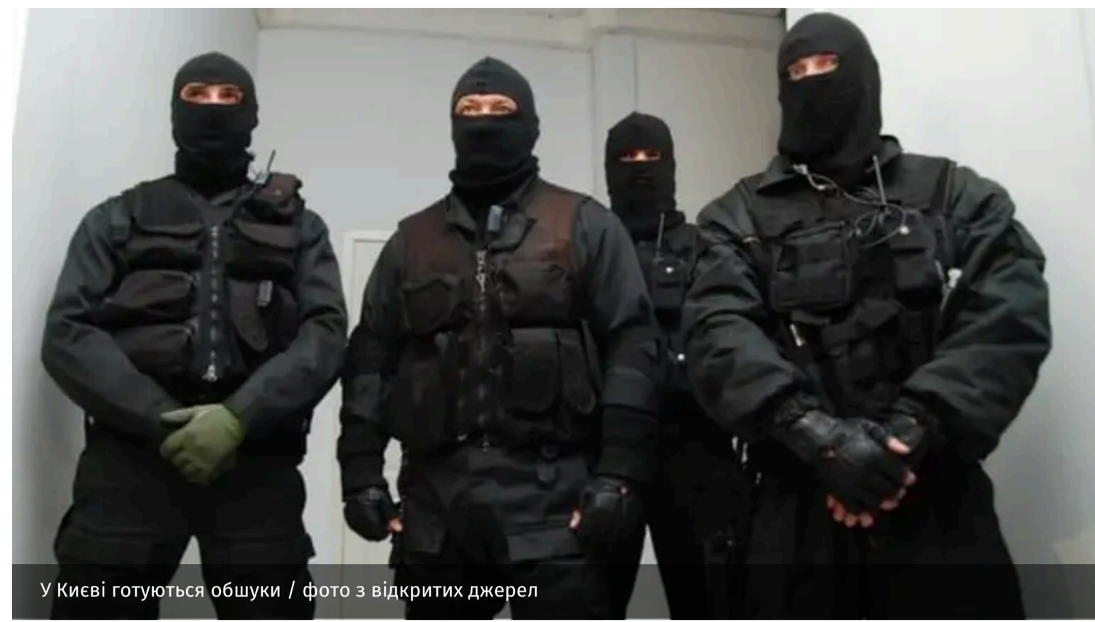
У Києві готуються обшуки

Упродовж найближчих днів у Києві можуть пройти нові хвилі обшуків і вручення підозр. За наявною інформацією, увага правоохоронців може бути зосереджена не лише на міських службах та представниках оточення мера, а й на волонтерських і благодійних організаціях, які залучають допомогу від європейських партнерів для підтримки столиці.