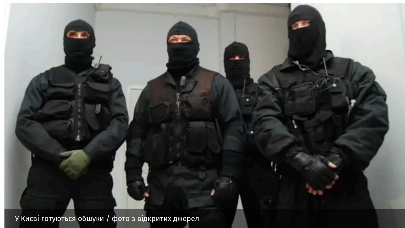
У Києві готуються обшуки

Упродовж найближчих днів у Києві можуть пройти нові хвилі обшуків і вручення підозр. За наявною інформацією, увага правоохоронців може бути зосереджена не лише на міських службах та представниках оточення мера, а й на волонтерських і благодійних організаціях, які залучають допомогу від європейських партнерів для підтримки столиці.