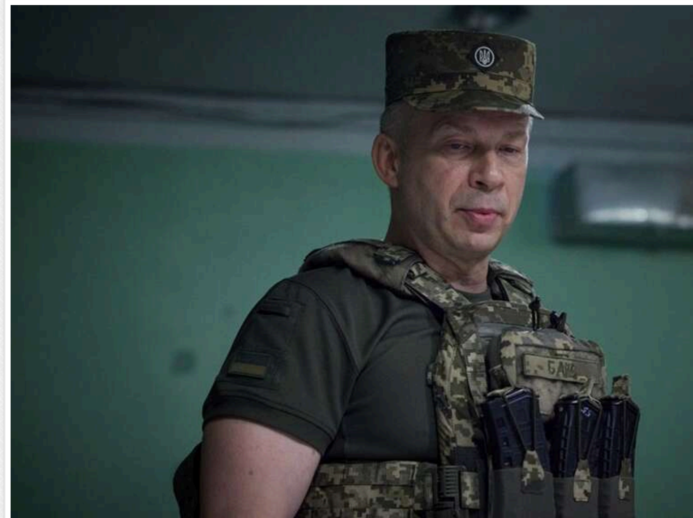
Сирський затвердив план розвитку сержантського корпусу ЗСУ до кінця 2027 року

Головнокомандувач ЗСУ Олександр Сирський затвердив план розвитку сержантського корпусу до кінця 2027 року. Документ передбачає розширення повноважень сержантів, нові кар'єрні механізми та підвищення соціальних стандартів.