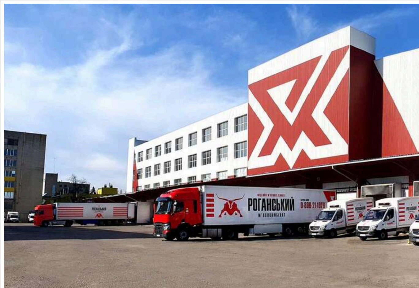
Справа Роганського м'ясокомбінату переросла у викриття транснаціональної схеми імпорту сировини на 350 мільйонів

Читати на руськом Read in English Додати як бажане джерело в Google