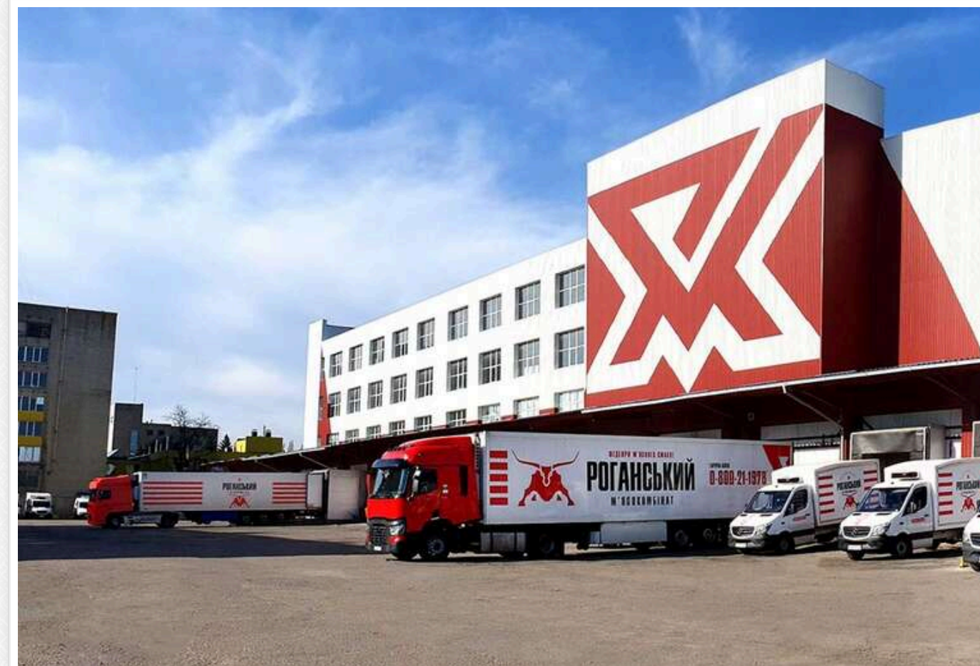
Справа Роганського м'ясокомбінату переросла у викриття транснаціональної схеми імпорту сировини на 350 мільйонів

До 2024–2025 років слідство у справі Роганського м'ясокомбінату (провадження № 4202300000001245) вийшло далеко за межі початкових звинувачень. У матеріалах з'явилася нова масштабна лінія — правоохоронці заявили про викриття транснаціональної групи, яка імпортувала в Україну низькоякісну м'ясну та рибну сировину за підробленими ветеринарними сертифікатами.