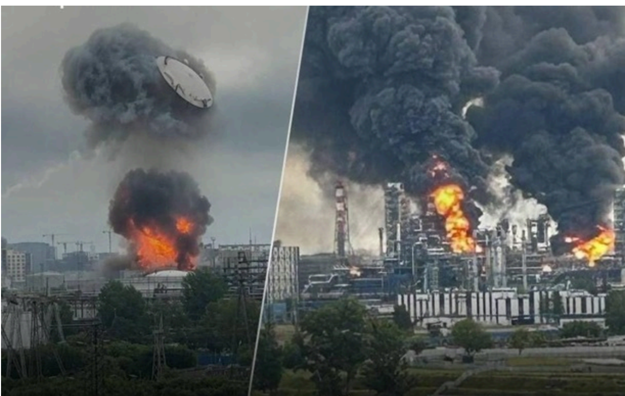
Пожежа на НПЗ у Москві

Також під удари потрапили нафтобаза, залізничний міст через Північно-Кримський канал та інші об'єкти противника.