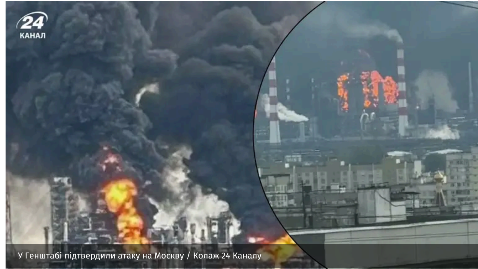
У Генштабі підтвердили атаку на Москву

Сили оборони повідомили про серію ударів по стратегічних об'єктах у Московській області. Також відомо про наслідки в Ростовській області Росії, а також на тимчасово окупованих територіях.