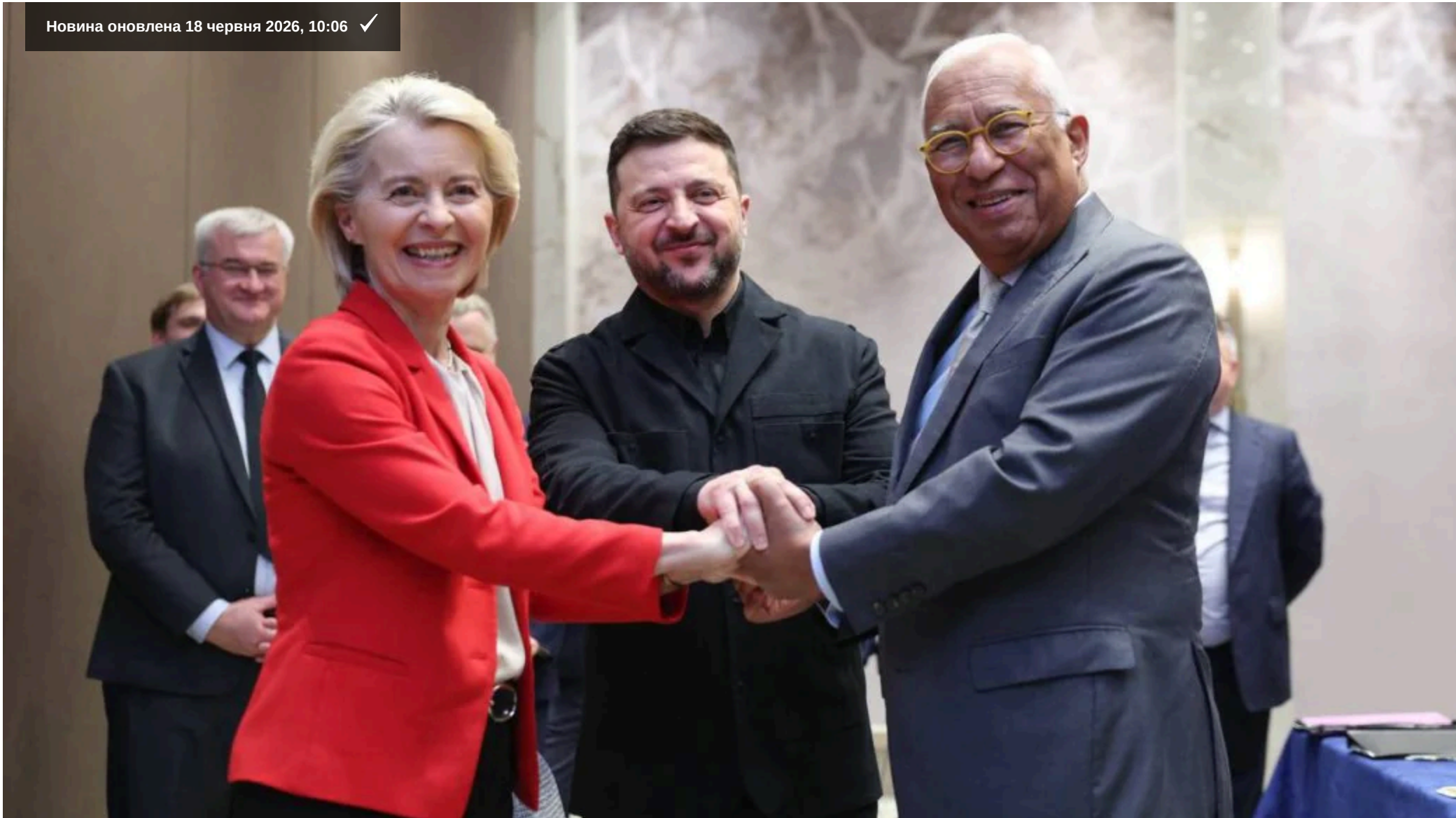
Президент України і керівництво ЄС.

Влітку можна чекати нового етапу переговорів.