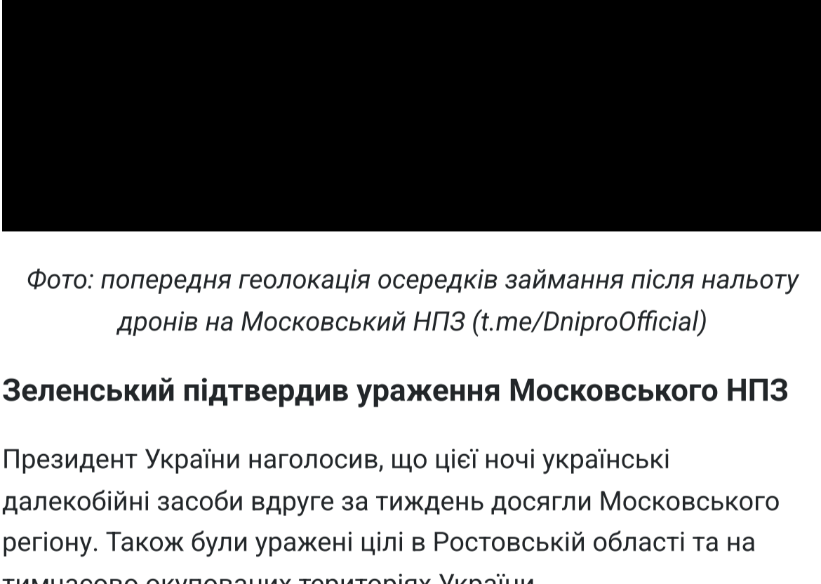
Фото: попередня геолокація осередків займання після нальоту дронів на Московський НПЗ

Завод переробляє близько 11 млн тонн нафти на рік та забезпечує близько 40% паливного ринку Москви.