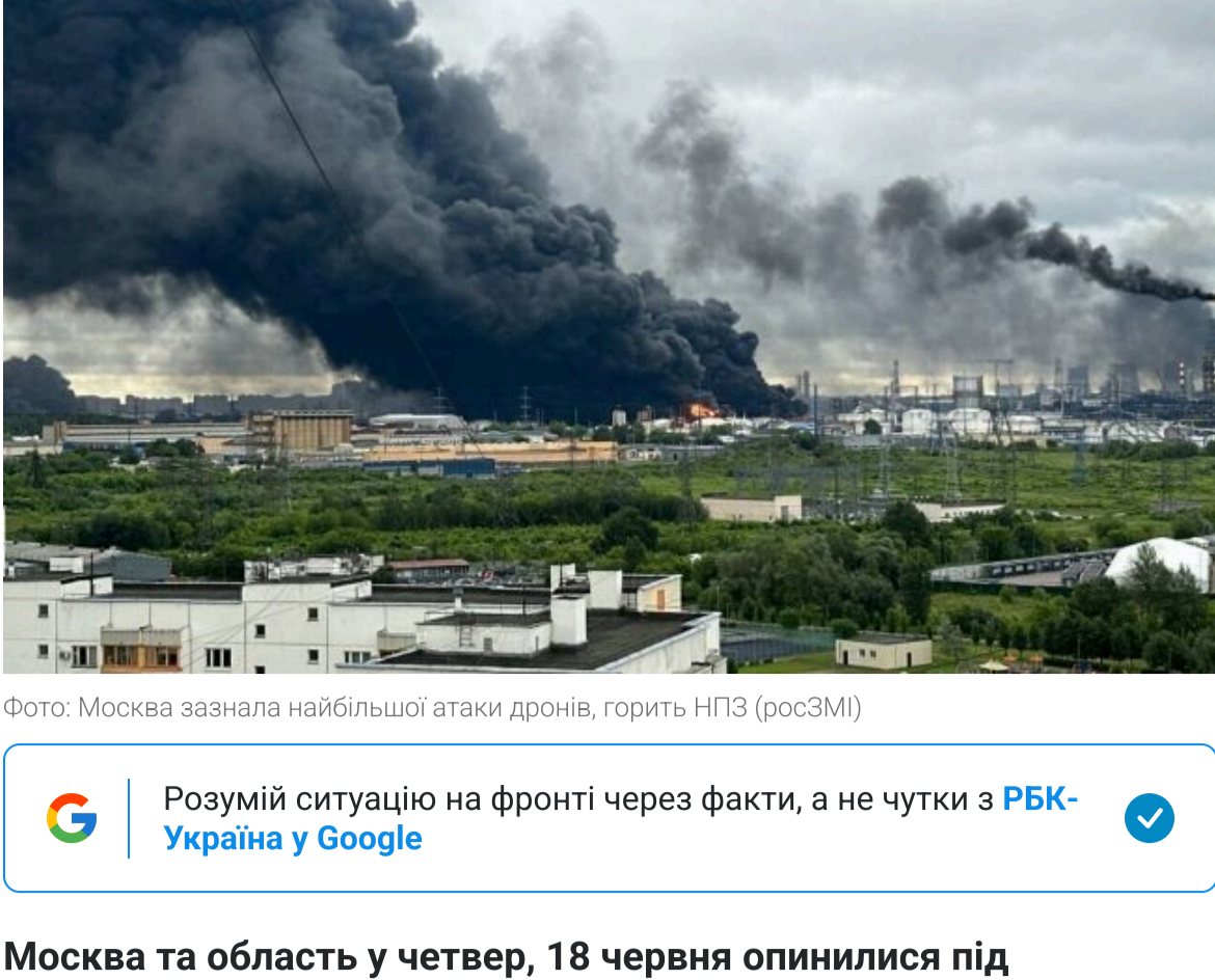
Фото: Москва зазнала найбільшої атаки дронів, горить НПЗ (росЗМІ)

Розумій ситуацію на фронті через факти, а не чулки з РБК-Україна у Google