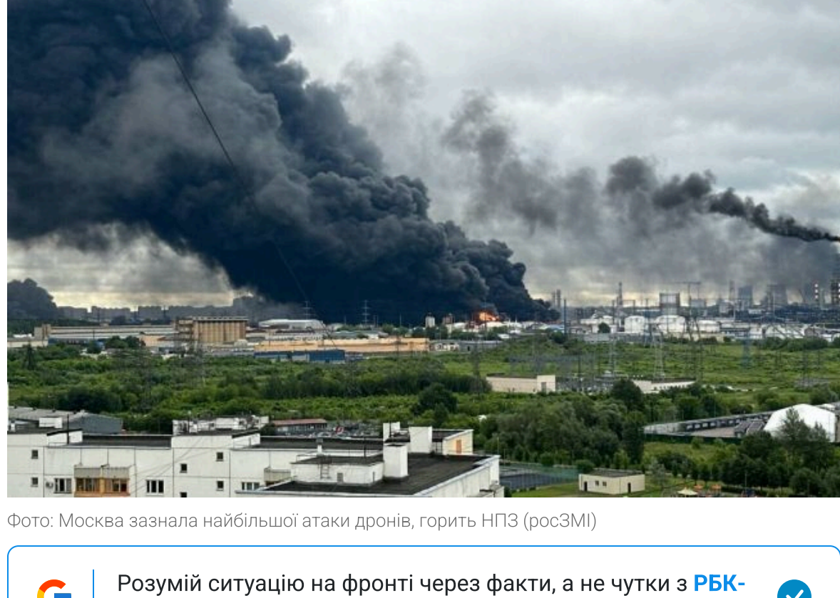
Фото: Москва зазнала найбільшої атаки дронів, горить НПЗ (росЗМІ)

Розумій ситуацію на фронті через факти, а не чулки з РБК-Україна у Google