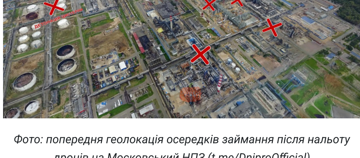
Фото: попередня геолокація осередків займання після нальоту дронів на Московський НПЗ (t.me/DniproOfficial)

Завод переробляє близько 11 млн тонн нафти на рік та забезпечує близько 40% паливного ринку Москви.