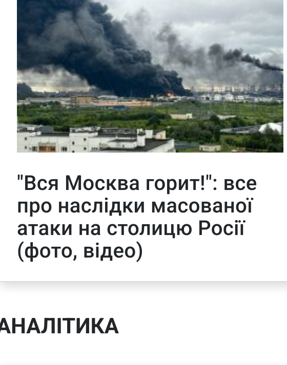
"Вся Москва горит!": все про наслідки масованої атаки на столицю Росії (фото, відео)