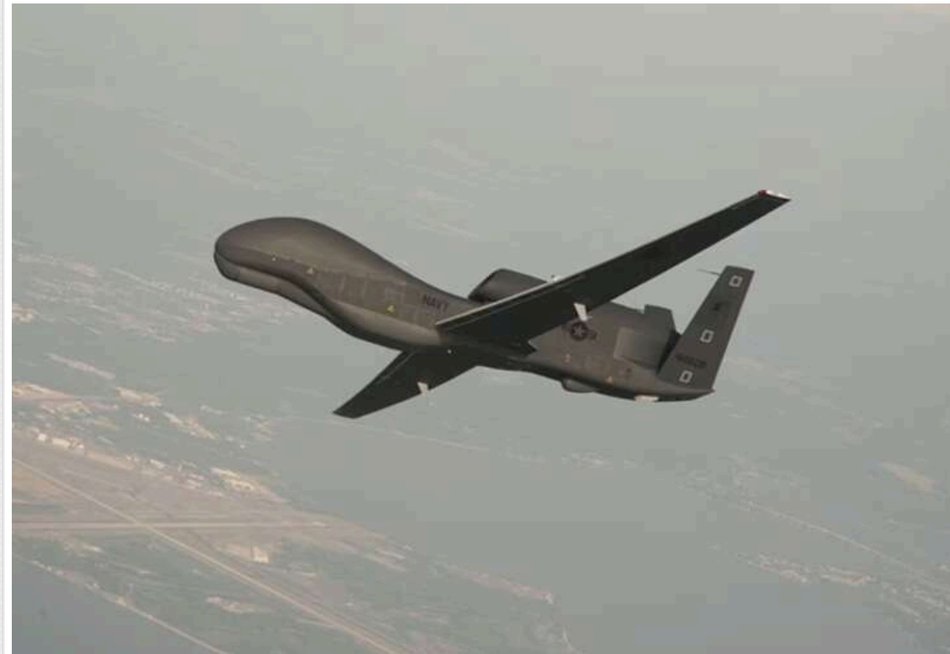
У Криму дрони атакували залізничний міст, який РФ використовує для військової логістики

У тимчасово окупованому Криму безпілотники атакували важливий залізничний міст через Північнокримський канал поблизу села Роздольне, після чого спалахнула пожежа, а місцеві жителі повідомили про близько 20 вибухів.