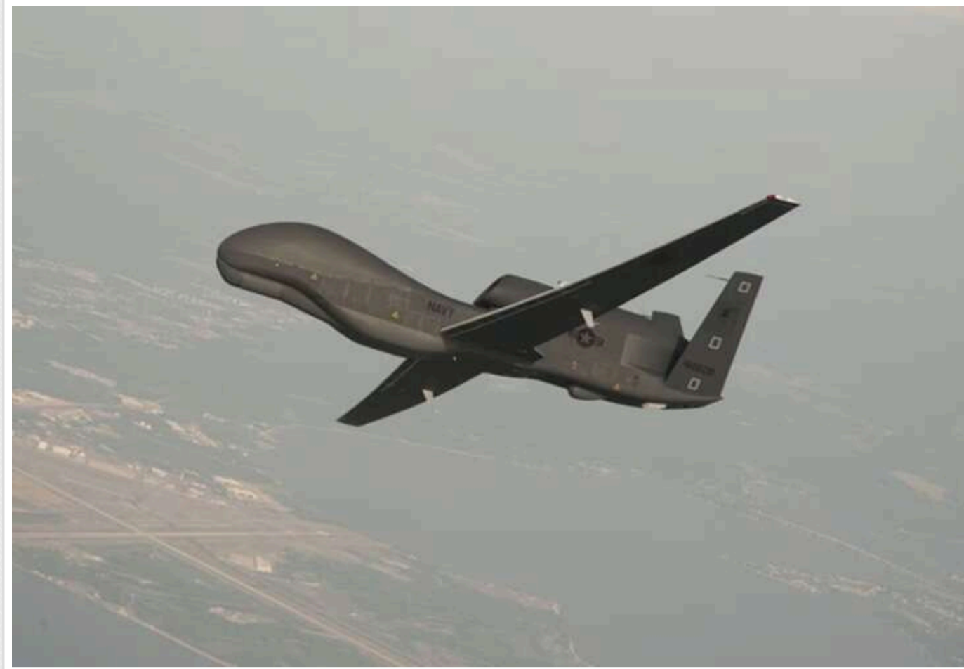
У Криму дрони атакували залізничний міст, який РФ використовує для військової логістики

У тимчасово окупованому Криму безпілотники атакували важливий залізничний міст через Північно-Кримський канал поблизу села Роздольне, після чого спалахнула пожежа, а місцеві жителі повідомили про близько 20 вибухів.