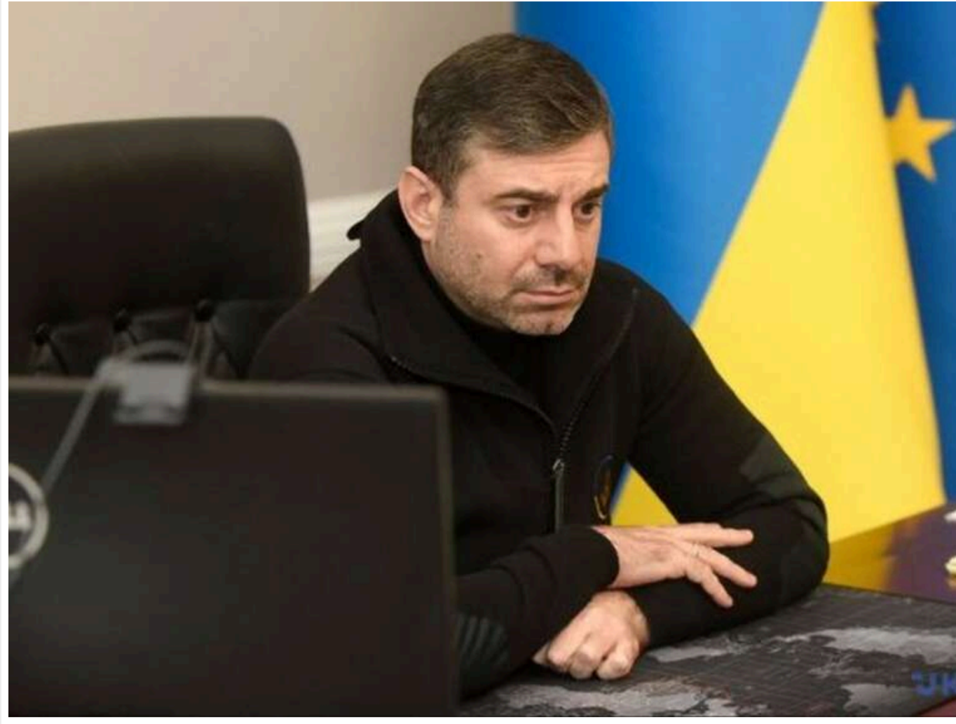
«Україна не має відношення»: Лубінець відреагував на заяви РФ та Білорусі про атаку на автобус із дітьми

Омбудсмен Дмитро Лубінець відреагував на заяви представників РФ та Білорусі про нібито ураження безпілотником ЗСУ автобуса з дітьми у Брянській області та зв'язався з білоруською стороною для з'ясування "первинної інформації щодо інциденту". Він наголосив, що Україна не має жодного відношення до цієї події.