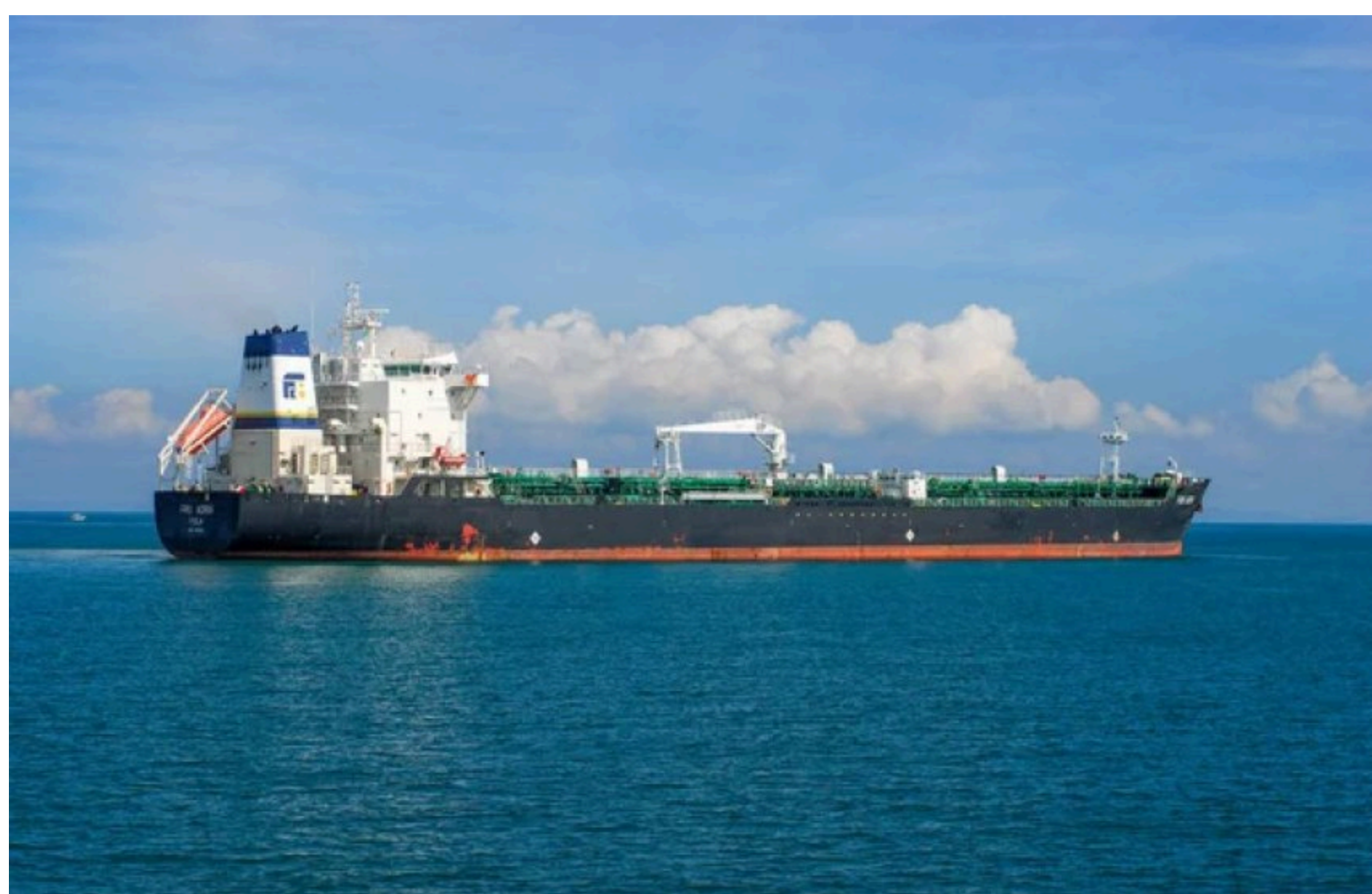
Ціна нафти на 18 червня

Станом на 18 червня 2026 року ціна нафти Brent становить $77,67 за барель, WTI – $74,78, а Urals – $64,16. Через зняття санкцій з Ірану та відкриття Ормузької протоки світові ціни на нафту впали більш ніж на долар.