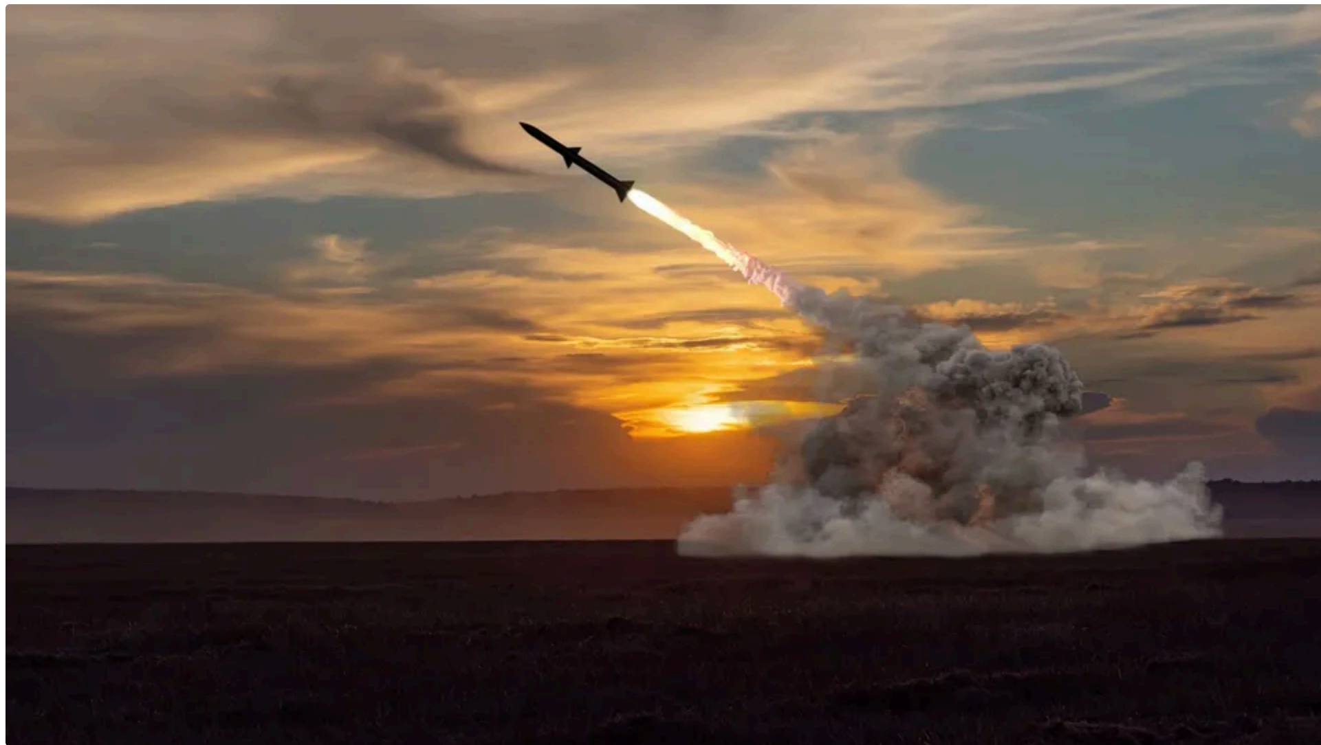
У травні ППО збила менш як кожну п'яту балістичну ракету

18 червня, 09:06 🗨️ Этот материал также можно прочитать на русском