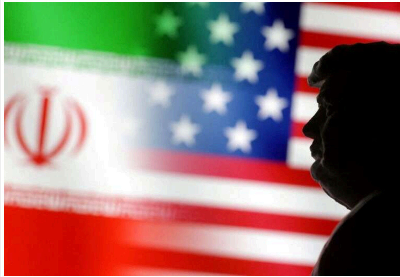
США оприлюднили ключові пункти меморандуму з Іраном: 14 пунктів мирної угоди

Американсько-іранський конфлікт переходить у стадію докладних переговорів. Адже підписання мирного меморандуму вже відбулося, тільки не наживо, а онлайн.