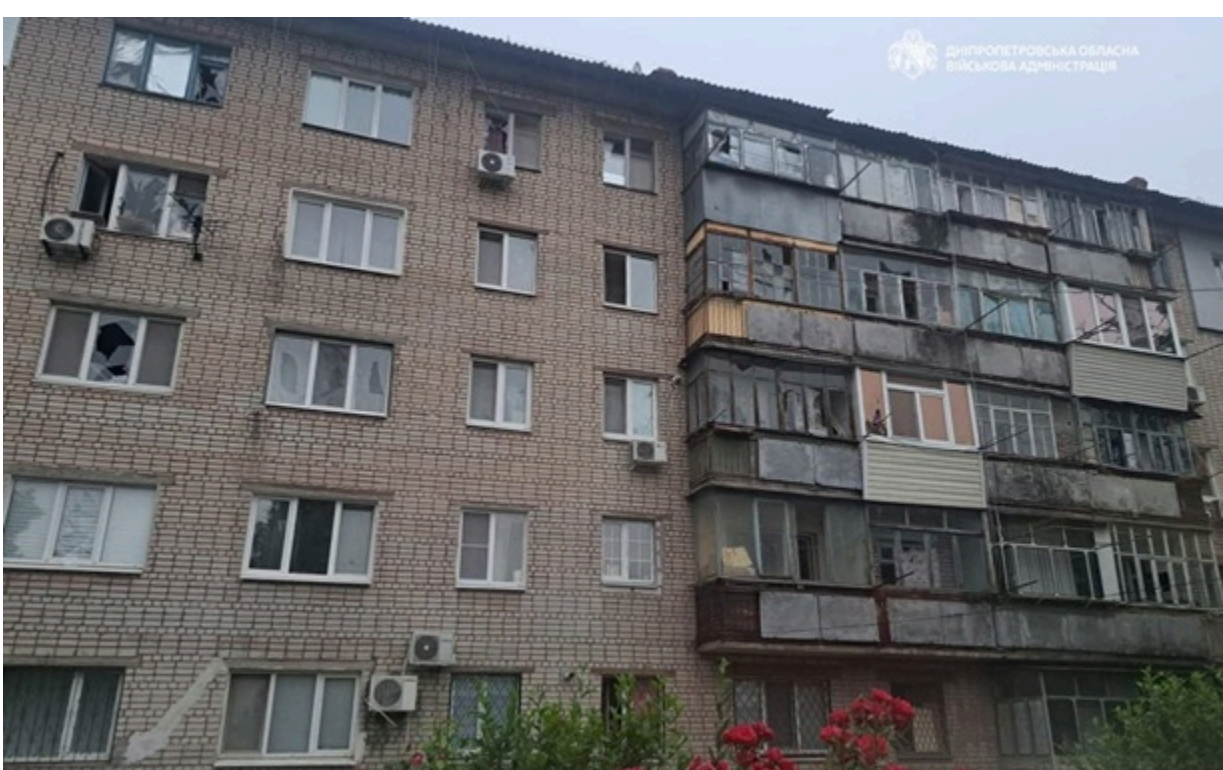
Фото: Дніпропетровська ОВА. Безпілотниками, артилерією та авіабомбою РФ атакувала мирних мешканців Дніпропетровщини

Понад десять разів ворог атакував п'ять районів безпілотниками, артилерією та авіабомбою. Поранена одна людина.