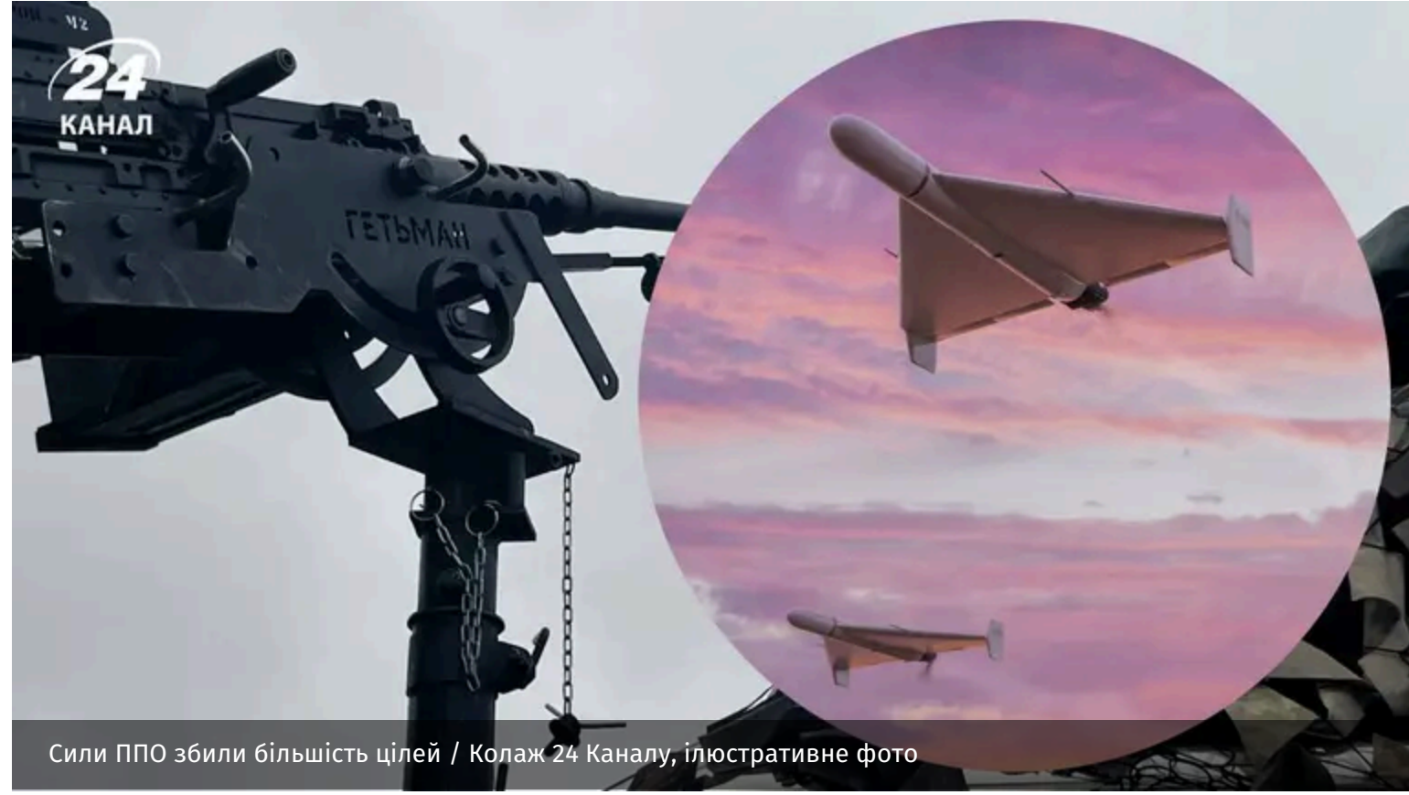
Сили ППО збили більшість цілей / Колаж 24 Каналу, ілюстративне фото

Росія вночі 18 червня атакувала Україну за допомогою ударних безпілотників та ракет. Більшість повітряних цілей вдалося збити силами ППО.