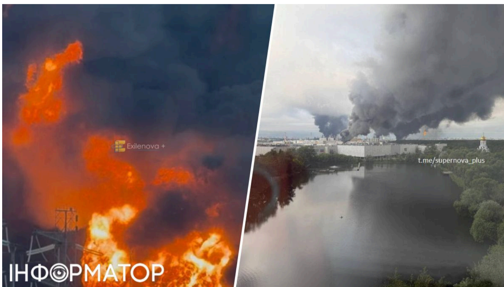
Дрони вдарили по НПЗ у Москві

Українські безпілотники атакували Московський нафтопереробний завод у районі Капотня - за 15 кілометрів від Кремля. Безпілотники вдруге за два дні здійснили атаку на найбільший нафтопереробний завод Москви. Горять мінімум два резервуари, а місто накрив густий чорний дим. Атака спровокувала транспортний колапс у небі над РФ - аеропорти Внуково та Шереметьєво запровадили жорсткі обмеження, а Домодедово та Жуковський повністю призупинили роботу.