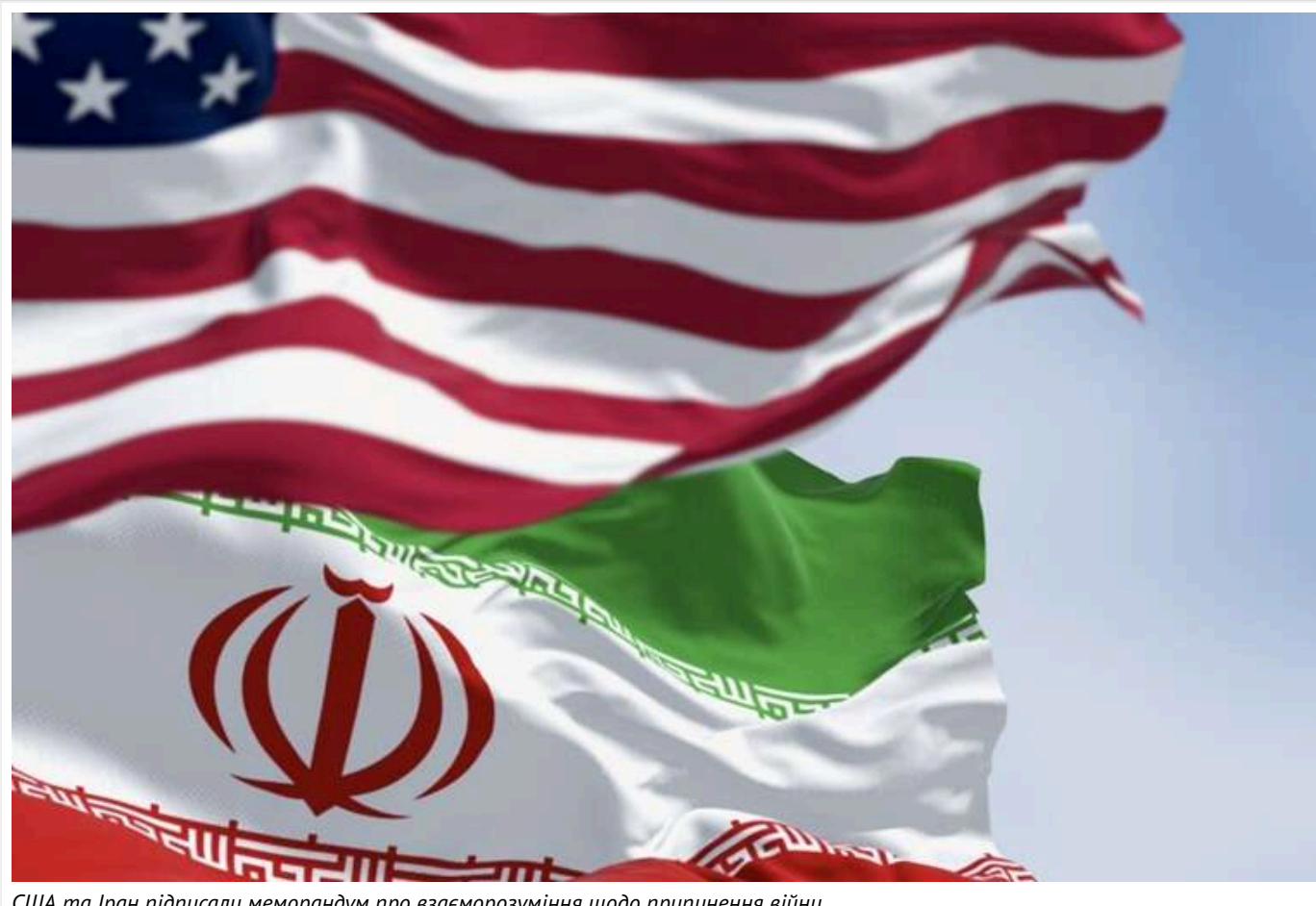
США та Іран підписали меморандум про взаєморозуміння щодо припинення війни