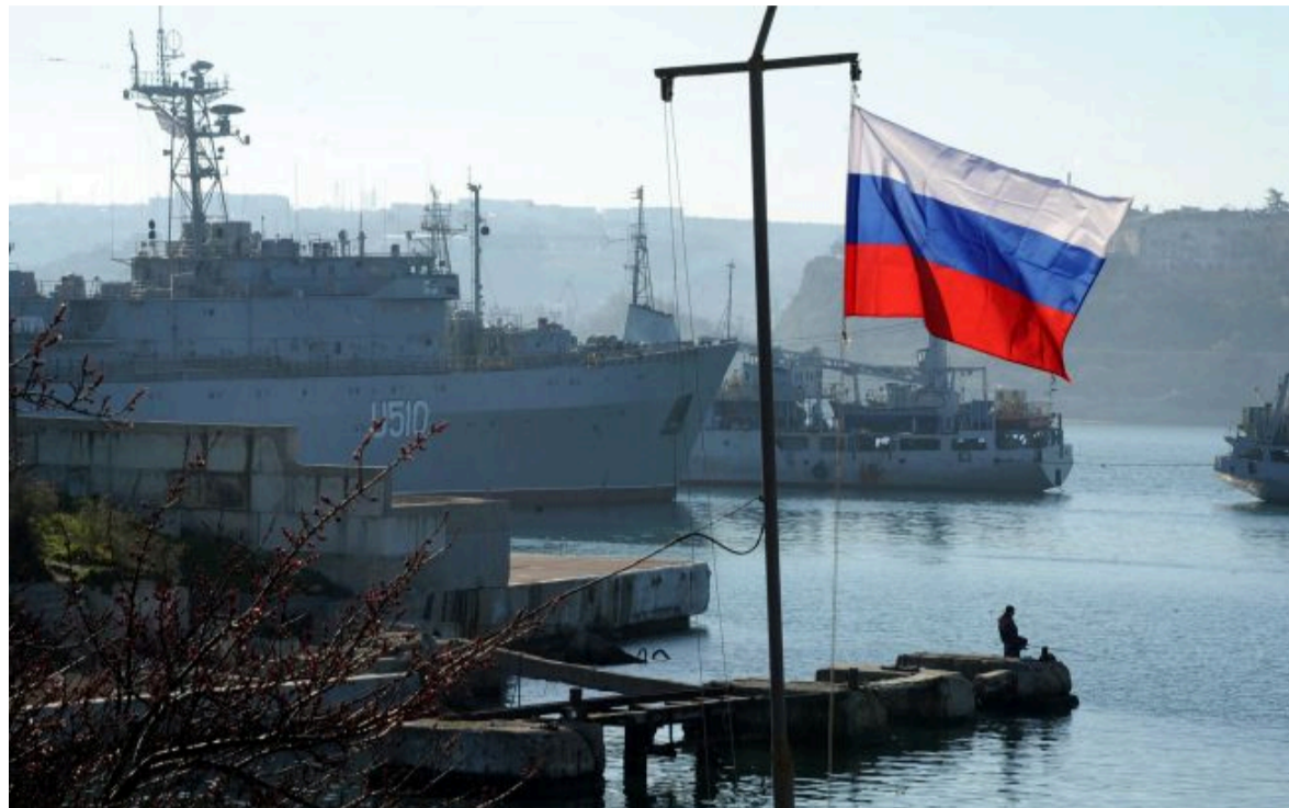
Фото: в ЄС вже говорюють про наступний, 22 пакет санкцій