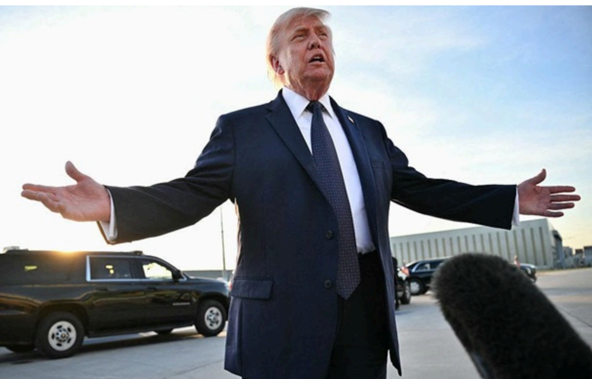
Президент Трамп особисто підписав примірник угоди під час вечері з президентом Франції

Меморандум про взаєморозуміння містить зобов'язання сторін провести додаткові переговори протягом найближчих 60 днів.