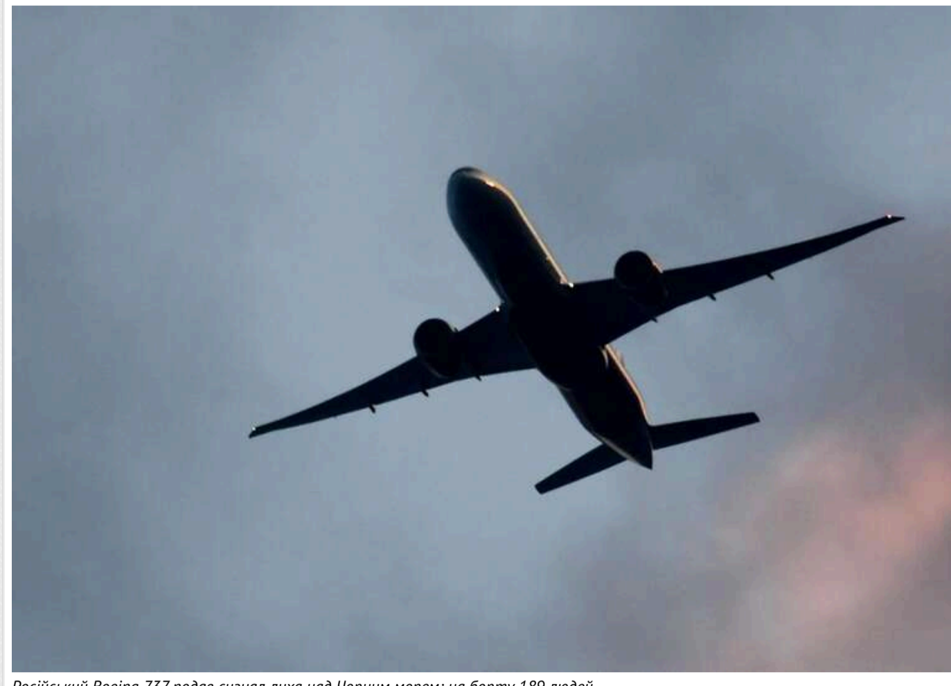
Російський Boeing 737 подав сигнал лиха над Чорним морем: на борту 189 людей

Читати на руськом Read in English Додати як бажане джерело в Google