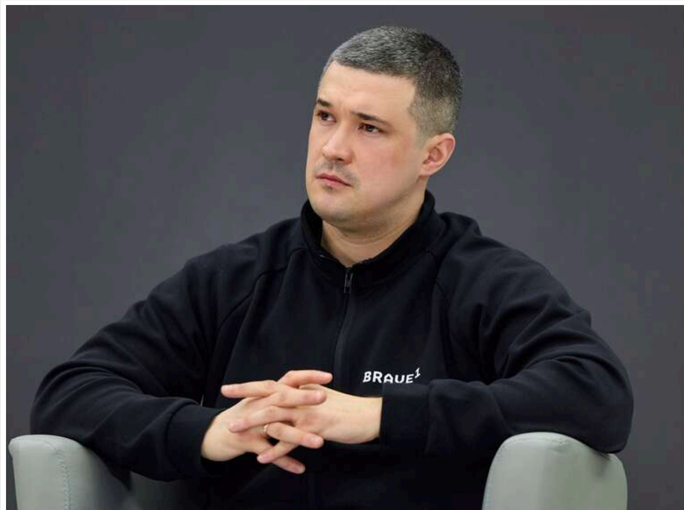
«Мали особисту розмову»: Федоров поділився деталями комунікації з Маском щодо відключення Starlink окупантам

Читати на руском Read in English Додати як бажане джерело в Google