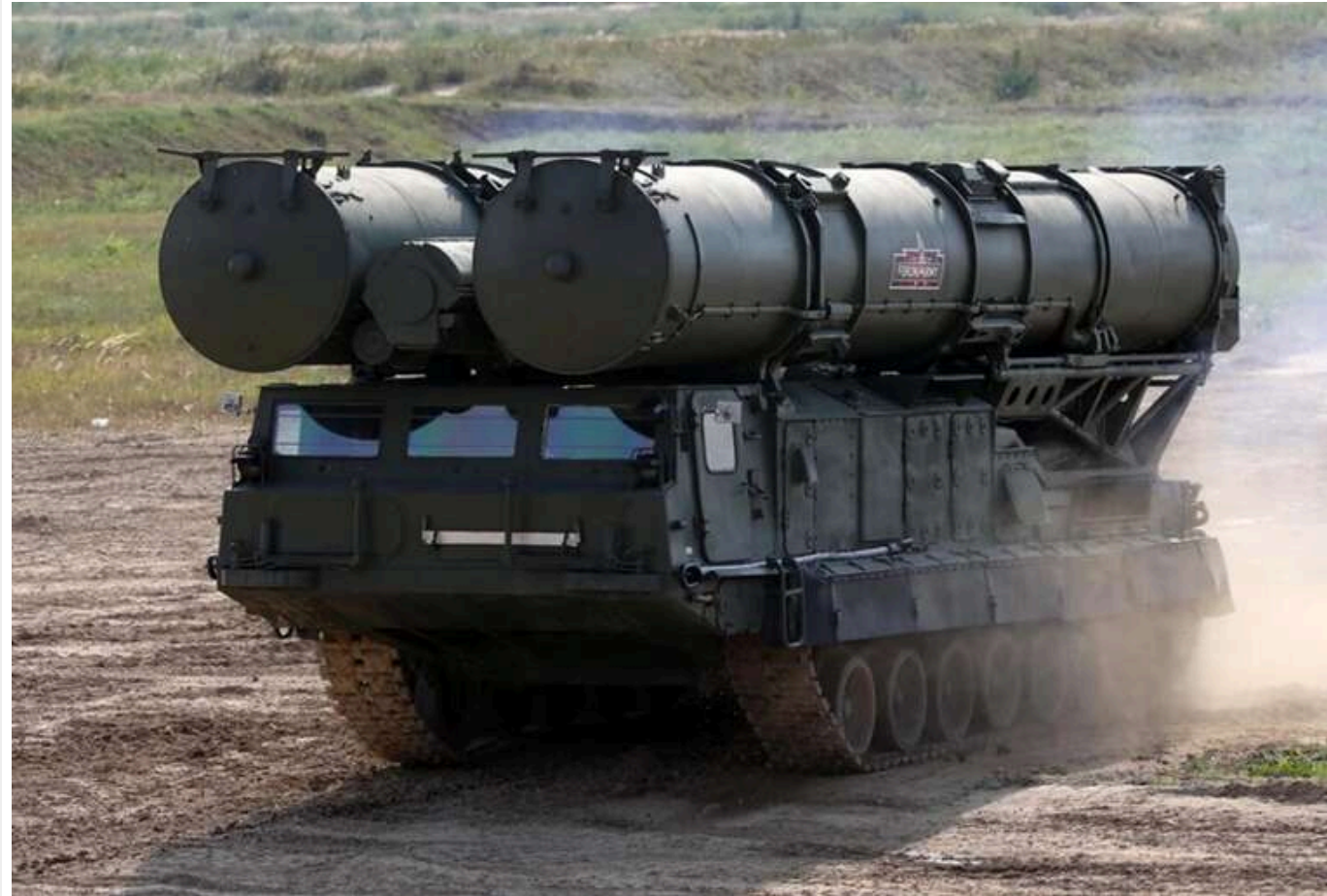
CBS News: Далекобійні удари ЗСУ створили в Росії гострий дефіцит ракет до ЗРК С-300

Успішні далекобійні удари України призвели до гострого дефіциту ракет-перехоплювачів до російських зенітно-ракетних комплексів С-300. Це дозволяє ЗСУ ефективніше нищити військові об'єкти у глибокому тилу РФ.