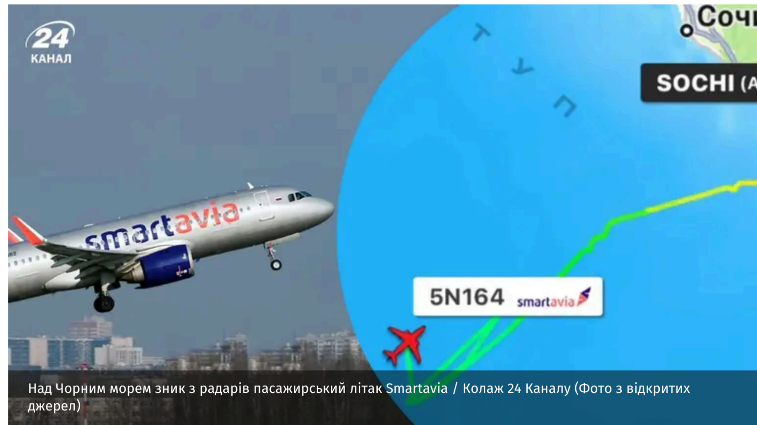
Над Чорним морем зник з радарів пасажирський літак Smartavia

Пасажирський літак російської авіакомпанії Smartavia, що виконував рейс із Сочі до Архангельська, подав сигнал лиха під час польоту над Чорним морем. Після передачі аварійного коду 7700 борт зник з радарів.