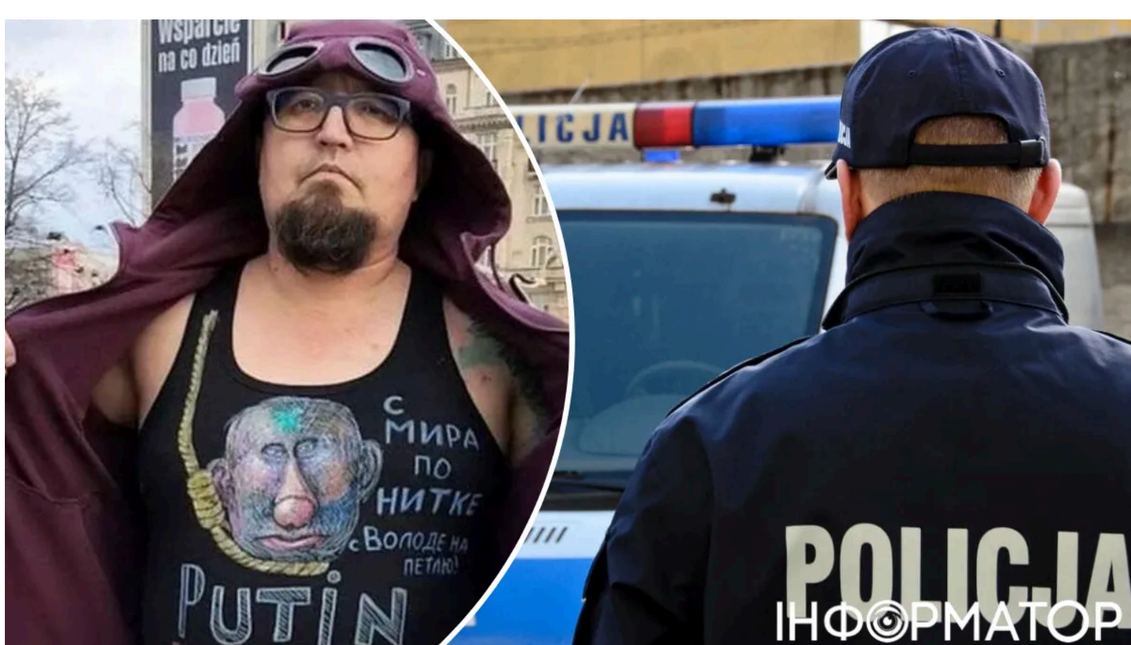
Підозрюваних у вбивстві Скрепецького відпустили

Польська прокуратура відпустила двох білоруських громадян, яких раніше затримали у зв'язку з убивством російського художника-опозиціонера Семена Скрепецького. Після допиту слідчі дійшли висновку, що затримані не брали участі у злочині, і перевели їх зі статусу підозрюваних у статус свідків. Загибель митця, яку польський прем'єр Дональд Туск назвав політично вмотивованою, досі залишається нерозкритою.