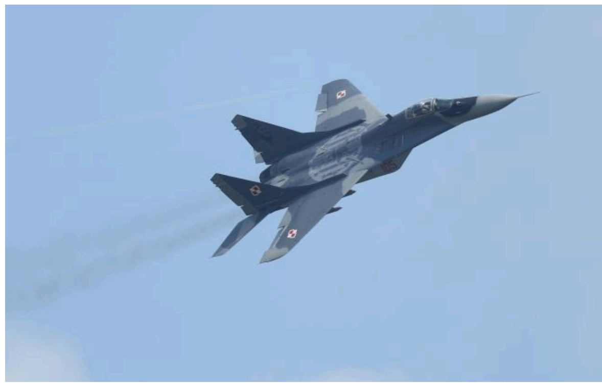
Фото: Польща пояснила, чому досі не передала Україні МіГ-29