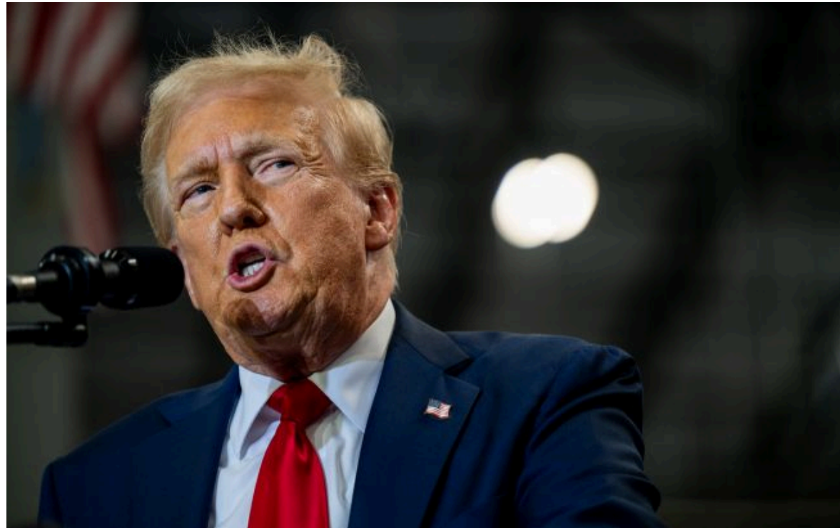
Фото: Дональд Трамп, президент США