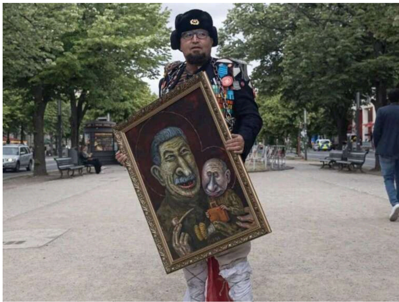
Польща звільнила двох білорусів у справі про вбивство російського художника Скрепецького: нападник досі не знайдений

Читайте на руськом Додати як бажане джерело в Google