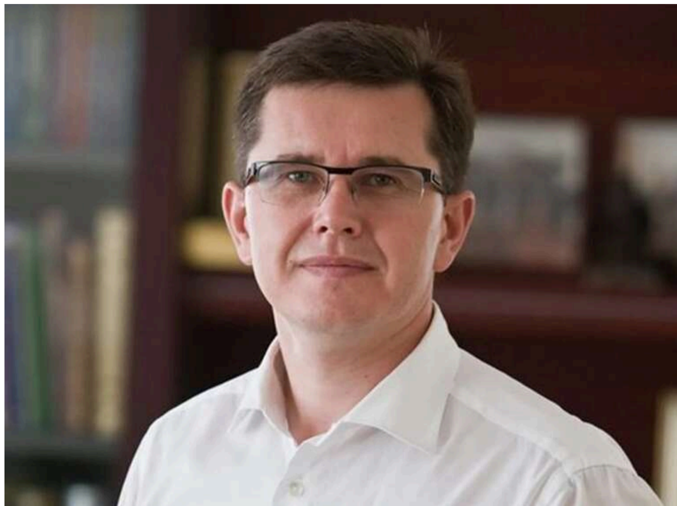
Голова апеляційного суду Кузьмишин задекларував будинок за 6,6 мільйона гривень та мільйони готівкою

Голова Сьомого апеляційного адміністративного суду Віталій Кузьмишин задекларував будинок вартістю понад 6,6 млн грн, квартиру та понад 2,4 млн грн готівкою.