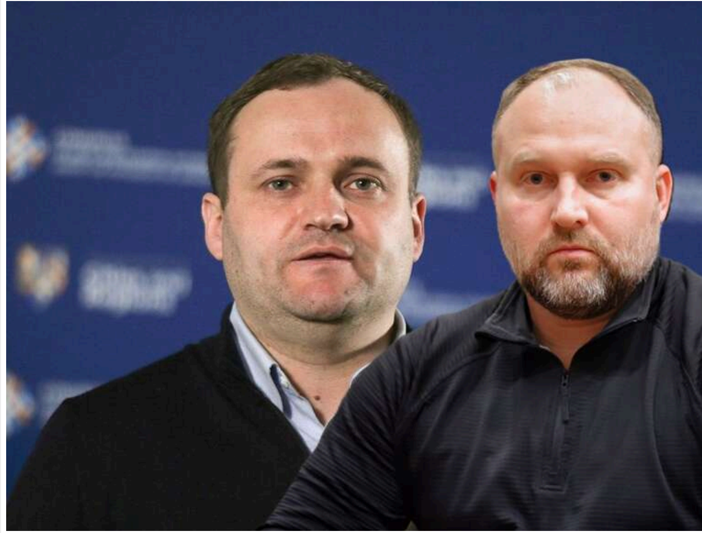
Тінь на Офіс Президента та євроінтеграцію: як скандали навколо Кулеби та Проніна б'ють по іміджу України

Читати на руськом Read in English Додати як бажане джерело в Google